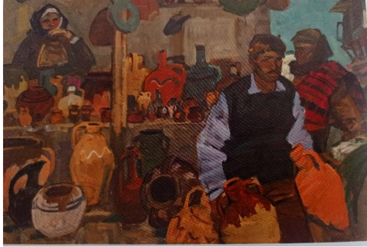
İLL 2. Vəcihə Səmədova “Sofiyada bazar” (1960) (kətan, yağlı boya)

nan bu silsilənin maraqlı əsəri kimi təqdim edilən Bolqarıstanın məişəti, insanların geyimini, keramika nümunələrinin təsviri multikultural dəyərlər kontekstində iki xalqın oxşar olduğunu sübut edir.