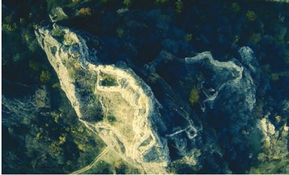
Şəkil 11. Hernabuc qalasının ümumi görünüşü