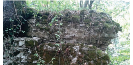
Şəkil 6. Zərnə qalasında divar qalıqlarının görünüşü (Qax)