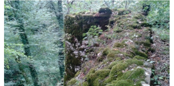
Şəkil 5. Zərnə qalasının 2 nömrəli bürcünün görünüşü (Qax)