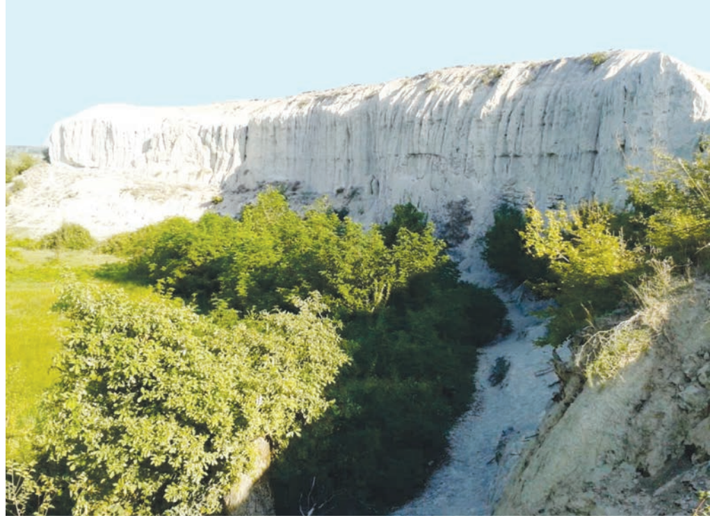
Şəkil 1. Tərkəş qalasının görünüşü (Oğuz)

Qalatap. Abidə Əlicançayın sol sahilində, Qayabaşı kəndi yaxınlığındakı təpənin üstündə tikilmişdir. Burada dairəvi formalı yastan yerinin diametri təqribən 200 m-ə yaxındır. Onun mərkəzi hissəsi kənarlarla müqayisədə təqribən 2–3 m çöküb. Arxeoloji tədqiqatlar nəticəsində abidənin divar qalıqları qeydə alınmışdır. Divar qalıqları təpənin üst hissəsinin dairəsini tam