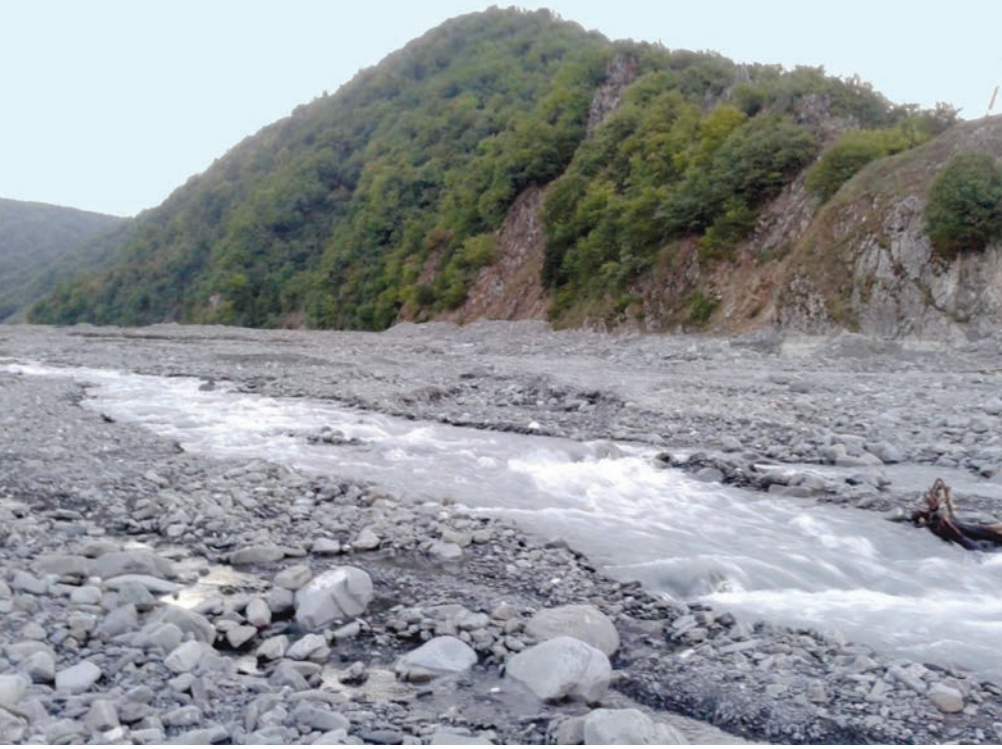
Şəkil 3. Xaçmaz Govurqalasının ümumi görünüşü (Oğuz)

Qalaya giriş şimaldan, iki bürc arasındakı darvaza yerindəndir. Onun eni 1,5 m, qorunmuş hissəsinin hündürlüyü 3 m-dir. Xaçmaz Govurqalasında darvaza yerində aparılmış arxeoloji qazıntı işləri qala darvazasının kiçik olduğunu söyləməyə əsas verir. Çünki buradan qalaya yalnız piyada və atlı süvarinin daxil olması mümkün ola bilərdi. Yuxarı hissəsi dağılmışdır. Darvaza yerində qala divarlarının eni 1,5 m, hündürlüyü isə salamat qalmış hissədə 3 m-dir. Darvaza yerinin sağ və sol tərəflərində düz divarlar vardır. Sağ tərəfdəki divarın uzunluğu 2,56, sol tərəfdəki divarın uzunluğu isə 2,64 m, darvaza yerinin eni 1,6 m-dir. Qala 7 bürcdən ibarət olmaqla xüsusi su kəməri vasitəsilə içməli su ilə təchiz edilirdi. Xaçmaz Govurqalasında 1–4 cərgədə qeydə alınmış dairəvi formalı mazğalların ölçüləri 20–36 x 18–26 sm və diametri 23 sm-dir. Aralarındakı məsafə 0,5–13 m-dir. Dairəvi mazğalların bir qismi içəridən suvanmışdır. Qala daxilində 12 otaq olduğu ehtimal edilir. Otaqlar düzbucaqlı formadadır, onlardan biri yarım-dairəvi bürcün içindədir. Govurqalada inşaat materialı kimi qaya və çay daşlarından, kirəc məhlulundan, puç daşdan yonulmuş, 22–26 x 34–35 x 5–10 sm ölçülərə malik lövhələrdən istifadə edilmişdir. Bunlardan əlavə, darvaza yerində başqa 23x23x5 sm ölçülərə malik bişmiş kərpic parçalarına da təsadüf edilmişdir. Aparılmış tədqiqatlar abidənin VII–XIII əsrlərə aid olduğunu söyləməyə əsas verir [Əliyev, 2014, s. 15; Əliyev, 2017, s. 58–59; Гади́ров, 1969, с. 15–19].