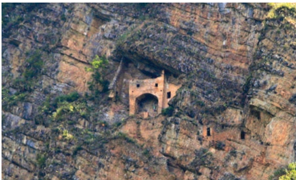
Şəkil 10. Pəri qalası (Yuxarı Çardaxlar, Zaqatala)

qala-istehkamda arxeoloji tədqiqat işləri aparmışdır. Bu zaman 0,8 ha ərazini əhatə edən ərazidə qala divarlarının planı hazırlanmış və çıxarılmışdır. Qala divarlarının bürclərində və onların salamat qalmış hissələrində arxeoloji kəşfiyyat qazıntıları və qeydlər aparılmışdır. Apardığımız elmi tədqiqatlar qalanın ilk orta əsrlərdə Qafqaz Albaniyasının mühüm strateji məntəqələrindən biri olduğunu söyləməyə əsas verir [Əliyev, 2018, s. 23–24] (şəkil 4, 5, 6, 7).