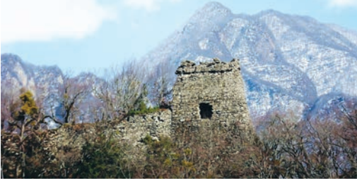
Şəkil 8. Cinli qalası (Qax)