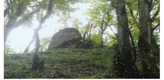
Şəkil 4. Zərnə qalasının 1 nömrəli bürcünün görünüşü (Qax)

Zərnə. 2018-ci ilin tədqiqat mövsümündə Oğuz-Qax arxeoloji ekspedisiyası Qax rayonunun Zərnə kəndində dağlıq relyefdə, meşəlikdə və Zərnəçayın sahilində olduqca strateji əhəmiyyətli yüksəklikdə yerləşən ilk orta əsr