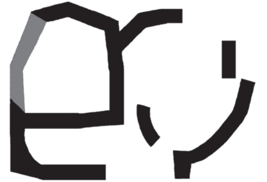
Şəkil 2. Tərkəş qalasında Qala yerinin planı (Oğuz) (T.V.Əliyev)