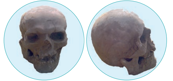
Şəkil 6. Kəllə №2