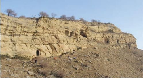
Şəkil 1. Keşikçidağ mağara-monastır kompleksinin panoraması