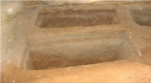
Şəkil 3. 19 sayılı mağaradakı qəbir