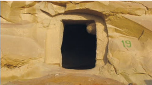
Şəkil 2. 19 sayılı mağaranın girişi