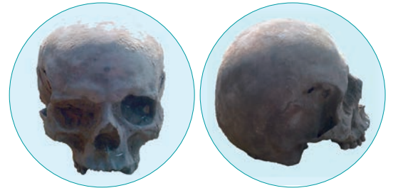
Şəkil 7. Kəllə №3