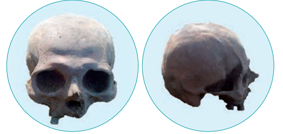
Şəkil 5. Kəllə №1

VIII–XIX əsrə aid mənbələrdə təsdiq edilir ki, Alban Həvari kilsəsinin mənsubları hərc-mərclik və müharibə dövrlərində Kürün sağ sahilində yerləşən mağaralardan həm dini, həm də strateji (belə yerlərdə qala və sığınacaqlar yaradılırdı) məqsədlərlə istifadə etmişlər. Məsələn, Gəncə, Qazax, Gədəbəy