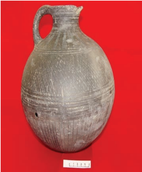
Şəkil 8. Kurqanda aşkar edilmiş keramika