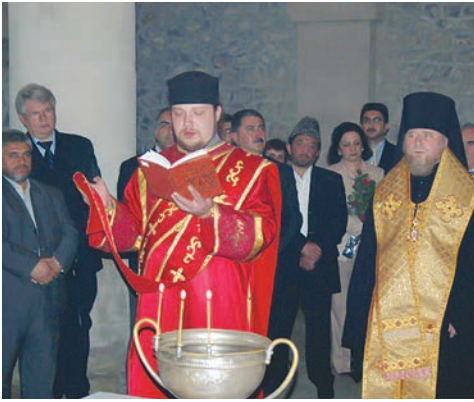
Nic qəsəbəsindəki Müqəddəs Yelisey (Cotari) kilsəsi