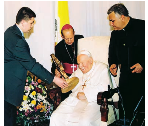
Alban xaçının Roma Papası II İohann Pavela təqdimatı. 2002-ci il