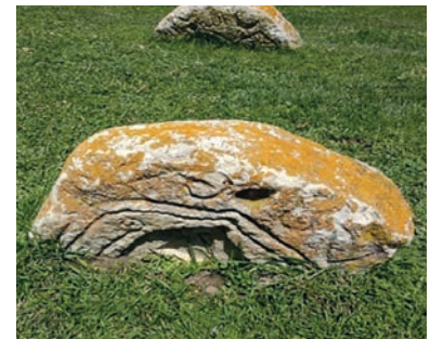
Şəkil 3. Qəbir daşları