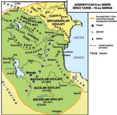
Şəkil 1. Azərbaycan IX–X əsrlərdə