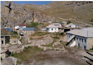
Şəkil 2. Qrız kəndinin ümumi görünüşü

rindən araşdırmaq olmur. Etnik və ya mifik adlarla bağlı olduğu görünə də, yerli əhalinin bu barədə maraqlanmaması araşdırma işlərini çətinləşdirir.