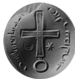
Şəkil 2. Albaniyanın Böyük Katalikosunun möhürü [9, s.65].