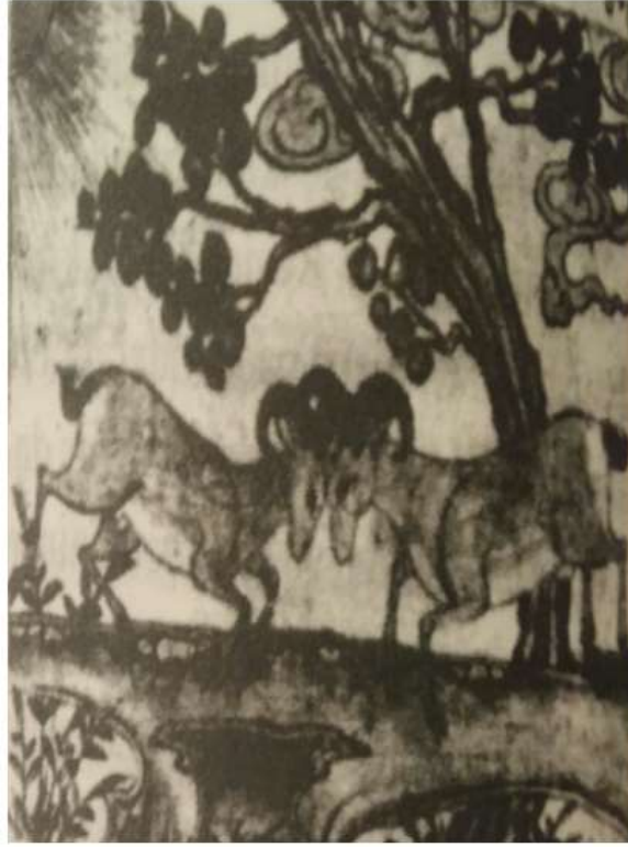
Şəkil 1. “Mənafi əl-heyvan” əsərinə çəkilmiş illüstrasiya. XIII əsr.

Yaradıcılığının çiçəklənmə dövrü XVI əsrin ortalarına təsadüf edən Soltan Məhəmmədin yaratdığı miniatürlərlə real həyat gözəlliklərinin vəsfi, insanın hiss və ehtiraslarını tərənnüm edərək dünyəvi hissləri qadağan edən dini ehkamlara qarşı qoyurdu. Onun yaratdığı miniatürlərdə çoxfiqurlu, mürəkkəbliyi və dinamikliyi ilə seçilən kompozisiyalarında mənzərə təsvirlərinin real və ifadəliliyi ilə diqqəti cəlb edir. Onun yaratdığı əsərlər rəssamın nə qədər dərin müşahidəçilik qabiliyyətinə malik olduğunu bir daha sübut edir. Təbiət motivlərinin ön plan çəkildiyi əsərlərindən Sankt-Peterburq Saltikov-Şedrin adına kitabxanada saxlanan Ə.Caminin “Silsilət-əz-zəhəb” əsərinin qoşa səhifəsini bəzəyən “Şahın şikarı” diptixi xüsusilə qeyd edilməlidir. Miniatürdə qəhvəyi, çəhrayı və boz rənglərin harmoniyası ilə sıldırım və yastı qayaların dairəvi düzülüşü kimi göstərilmişdir. Pələng, maral, ceyran, və s. heyvanların atlılar, övçular tərəfindən qovularaq ovalığa yığılması təsvir edilmişdir. Təsvir edilmiş ovalığın əlvan rəngli çiçəkləri, yaşıl otları nikbin ruhda yaradılmışdır.