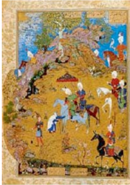
Şək. 1. Sultan Səncər və qarı. “Sirlər xəzinəsi” 1539-43 illər. Britaniya kitabxanası, London.