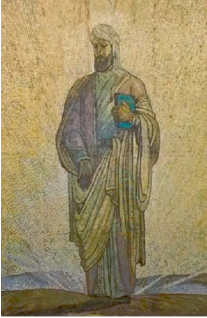
Şək. M. Abdullayev .Nizami mozaikasının eskiz təsviri