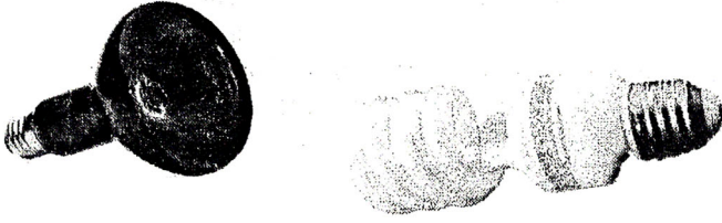
Şəkil 2. İnfra qırmızı lampa luminisent lampa

Quşların yetişdirilməsi zamanı HK 250W markalı infra qırmızı və luminisent tipli enerji qənaətedici IPA lampalarından istifadə edilmişdir [2; 3; 4; 5]. İnfra qırmızı lampalar istilik, IPA lampaları isə yaşıl işıq mənbəyi hesab edilir (şəkil 2).