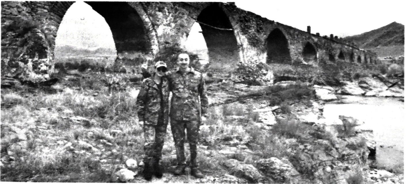
Azərbaycan Respublikasının Prezidenti Cənab İlham Əliyev və birinci xanım Mehriban Əliyeva işğaldan azad edilmiş Xudafərin körpüsünün önündə