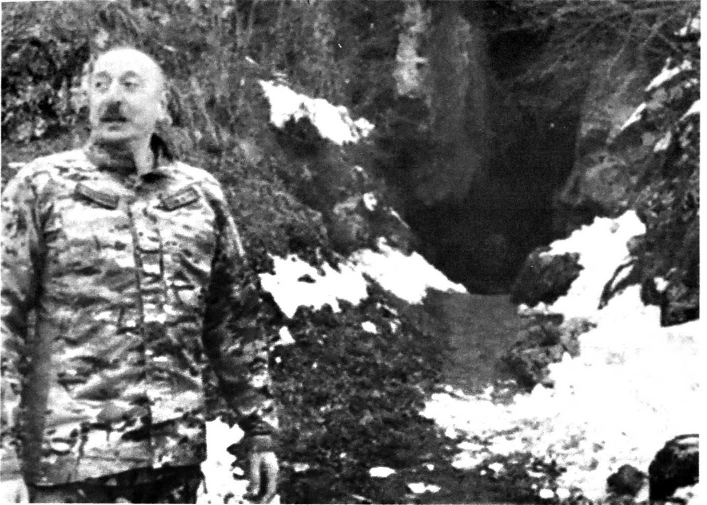
Azərbaycan Respublikasının Prezidenti Cənab İlham Əliyev işğaldan azad edilmiş Azix mağarasının önündə