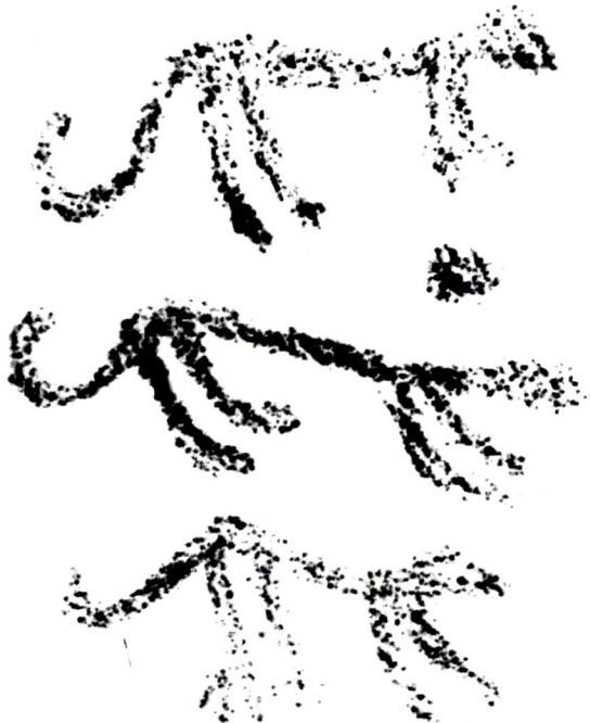
Şəkil 3. Kəlbəcər qayaüstü təsvirlərindən nümunə.