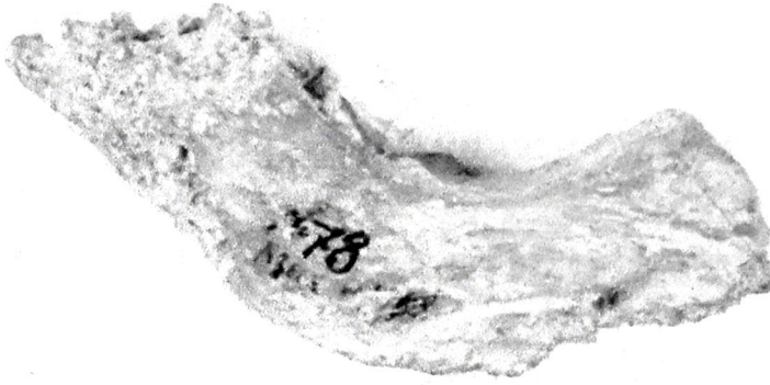
Şəkil 1. Azıx mağarasından aşkarlanmış alt çənə sümüyü.