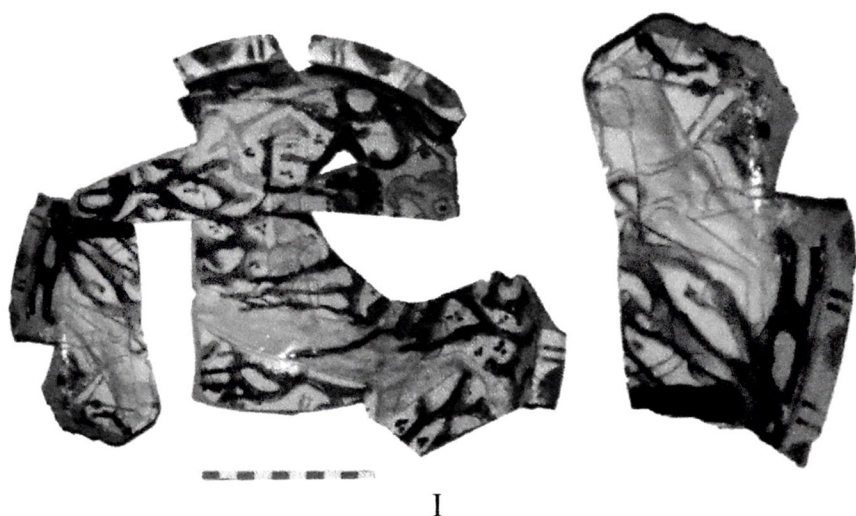
Şəkil I. Şirli polixrom boşqab üzərində süjetli səhnə.