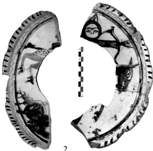
Şəkil II. Süjetli səhnə təsvir olunmuş şirli polixrom saxsı qab parçaları.