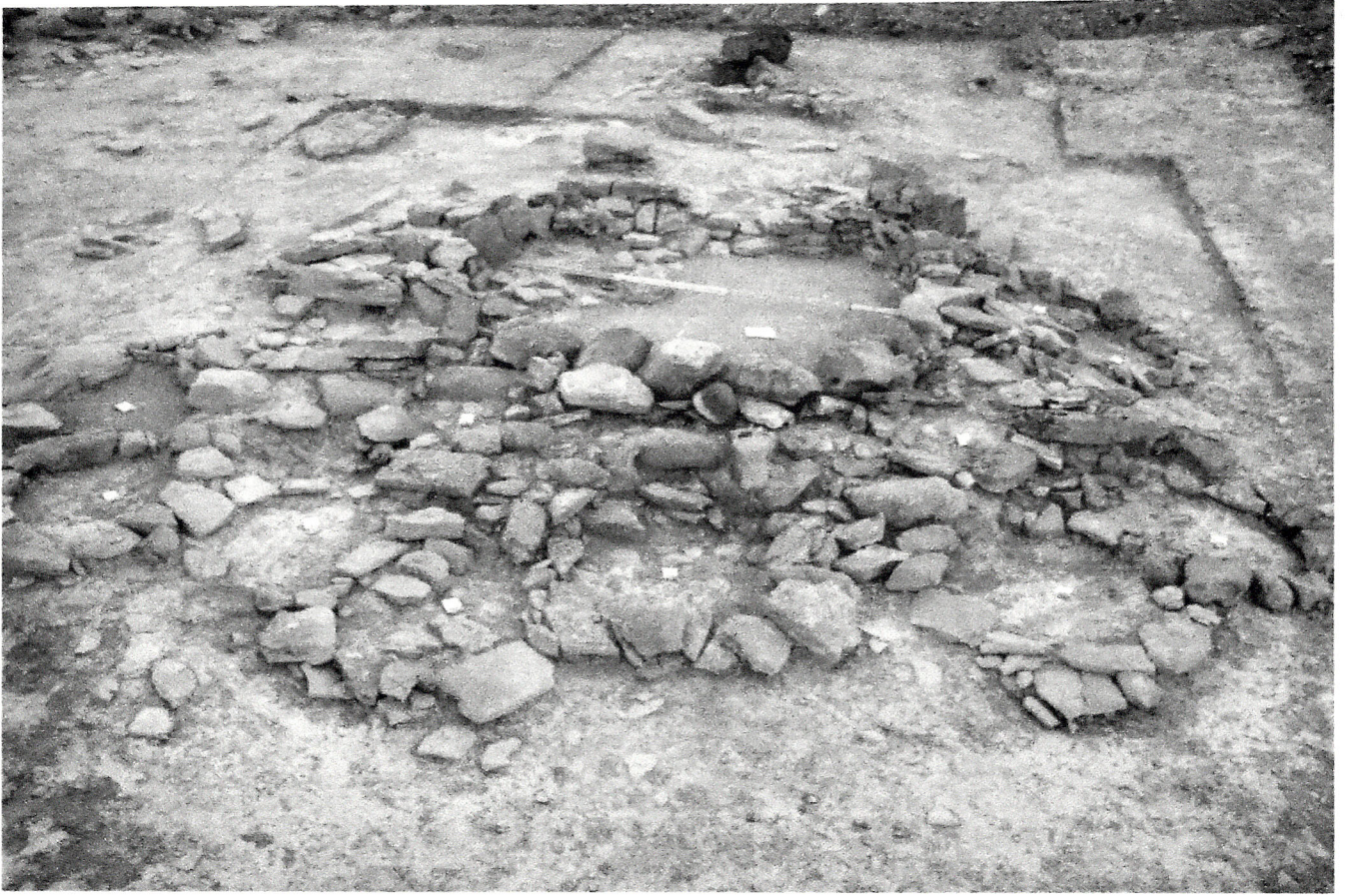
Şəkil 1. III Plovdağ nekropolunda kult təyinatlı dini kompleksin mərkəzi tikilisi.

plekslər ya nekropolların kənarında, ya da nekropolla yaşayış yerinin arasında yerləşmişdir.