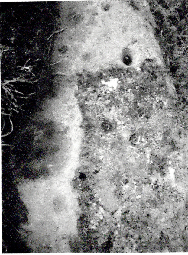
Şəkil 1. Daş üzərində kiçik oyuqlar.