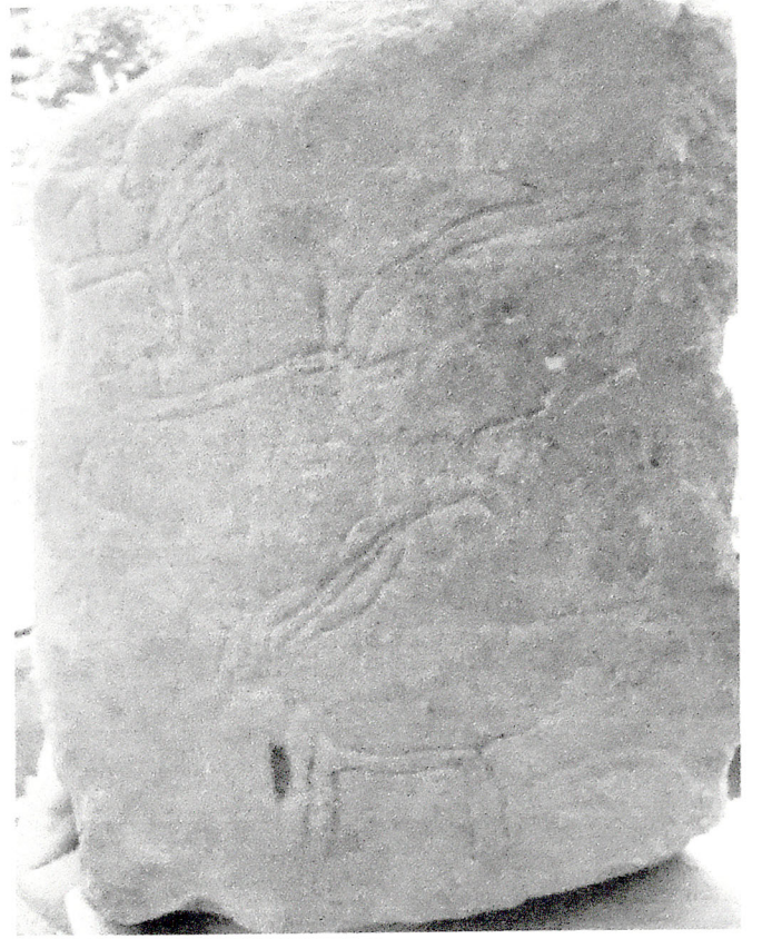
Şəkil 2. Keçi təsvirli kompozisiya.