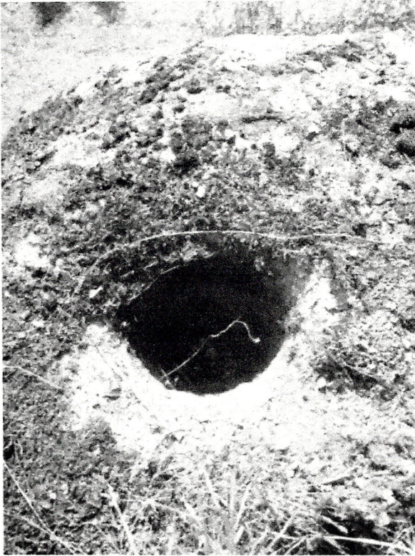
Şəkil 3. Daş üzərində yalaq.