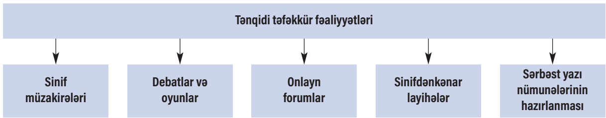
Sxem 2 Tənqidi təfəkkürün inkişafı yolları (Kow, 2016)

dilində düşünmə bacarıqlarını inkişaf etdirmək üçün rahat sinif otaqları və səmərəli resurslardan istifadənin əhəmiyyətini də qeyd edirlər.