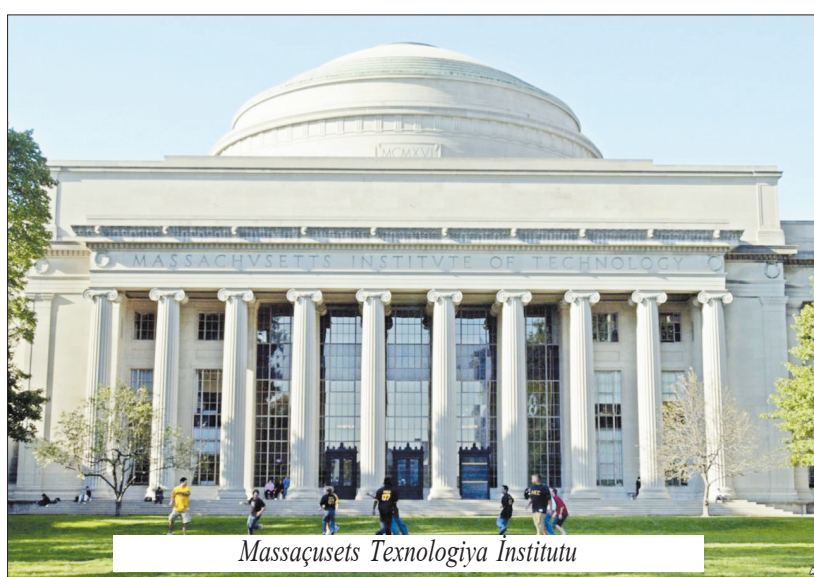
Massaçusets Texnologiya İnstitutu