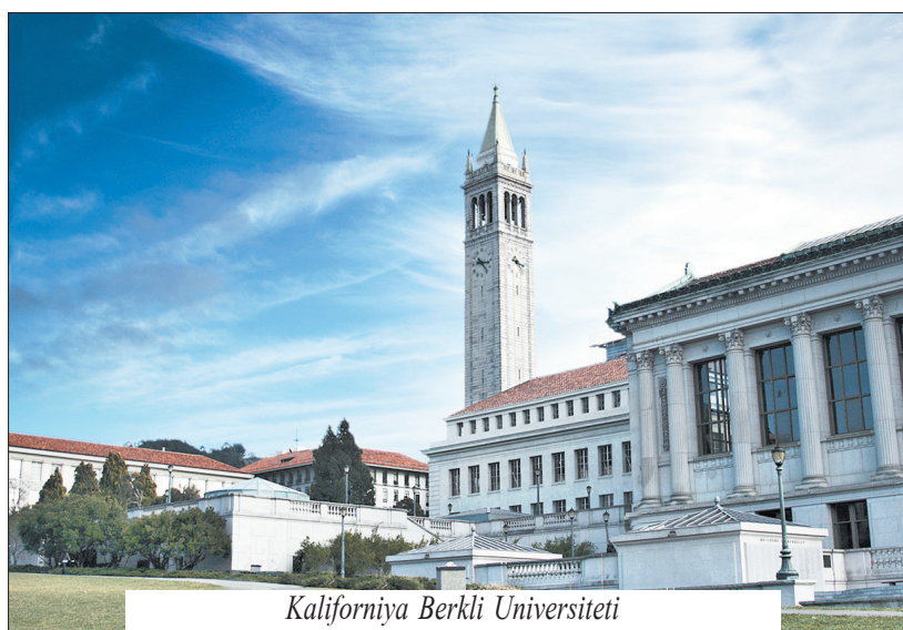
Kaliforniya Berkli Universiteti