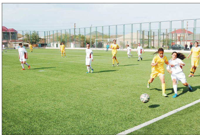
"Təhsil" Respublika İdman Mərkəzinin İxtisaslaşdırılmış Olimpiya Ehtiyatları Uşaq-Gənclər Futbol Məktəbinin komandası U-16 YUNİSEF qızlar liqası

rın keçirilməsi gəncləri pis vərdislərdən uzaqlaşdırır. Komanda yoldaşlarımızla hər oyun sonrası müzakirələr aparırıq. Güclü və zəif komandalar haqqında danışırıq. Düşünürəm ki, biz daha yaxşı oynaya biləcəyimizə ümid edirik. Hədəfimiz daha yaxşı və keyfiyyətli oyun sərgiləməkdir. Bundan başqa, tələbələrdən ibarət yığma komandaya seçilmək də ən böyük arzumdur.