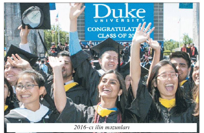
2016-cı ilin məzunları

rü üçün yardımların ümumi həcmi 42345 ABŞ dolları təşkil edib. Universitetin akademik heyəti 3428, kampusdakı inzibati işçilərinin sayı isə 8280 nəfərdir. Ali məktəbin müəllim heyətinin tərkibinə 943 professor, 226 əcnəbi mütəxəssis daxildir. Universitetin prezidenti Riçard Brodheddir. Universitetə qəbul çox yüksək rəqabət şəraitində keçir. Ali məktəbə qəbul cəmi 15 faiz təşkil edir. 2015-ci ildə ali məktəbə 29724 abituriyent sənəd verib, onlardan yalnız 13 faizi tələbə adını qazanıb. Əcnəbi tələbələr ingilis dili biliklərini (IELTS - 7.0 bal) və TOEFL (100 bal) nümayiş etdirməlidirlər. Universitetə daxil olan tələbələrdən 95 faizi ali məktəbi müvafiq diplomla bitirir.