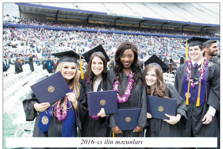
2016-cı ilin məzunları

üçün 48760, magistrələr üçün 15000 dollar təşkil edib. Tələbələrin 13 faizi əcnəbilərin (8035 nəfər) payına düşür. Vaşinqton Universitetinə 2015-ci ildə elmi tədqiqatların inkişaf etdirilməsi məqsədilə dövlət tərəfindən ayrılan illik maliyyə vəsaitlərinin həcmi 1.3 milyard dollara çatıb ki, bu da ölkənin hər hansı ali təhsil və digər təşkilatlarına ayrılan vəsaitdən çox yüksəkdir. 2009-cu illə müqayisədə Vaşinqton Universitetinin dövlət verdiyi iqtisadi mənfəət 2009-cu ildəki 9.1 milyard dollardan 2016-cı ildəki 12.5 milyard dollara çatıb. Universitetin 2015-2016-cı il maliyyə hesabatına əsasən, ötən tədris ilində ali məktəbin gəlir və xərclərinin ümumi həcmi 6.880.043.446 ABŞ dolları təşkil edib. 2016-2017-ci tədris ili üçün büdcənin gəlir və xərclərinin 7.067.513.000 ABŞ dollarına çatması proqnozlaşdırılır. Ali məktəbdə tələbə müəllim nisbəti 20:1 təşkil edir. Auditoriyaların 37,6 faizi hər birində 20 tələbə olmaqla formalaşmış. Tələbə məmnunluğu 94 faizdir.