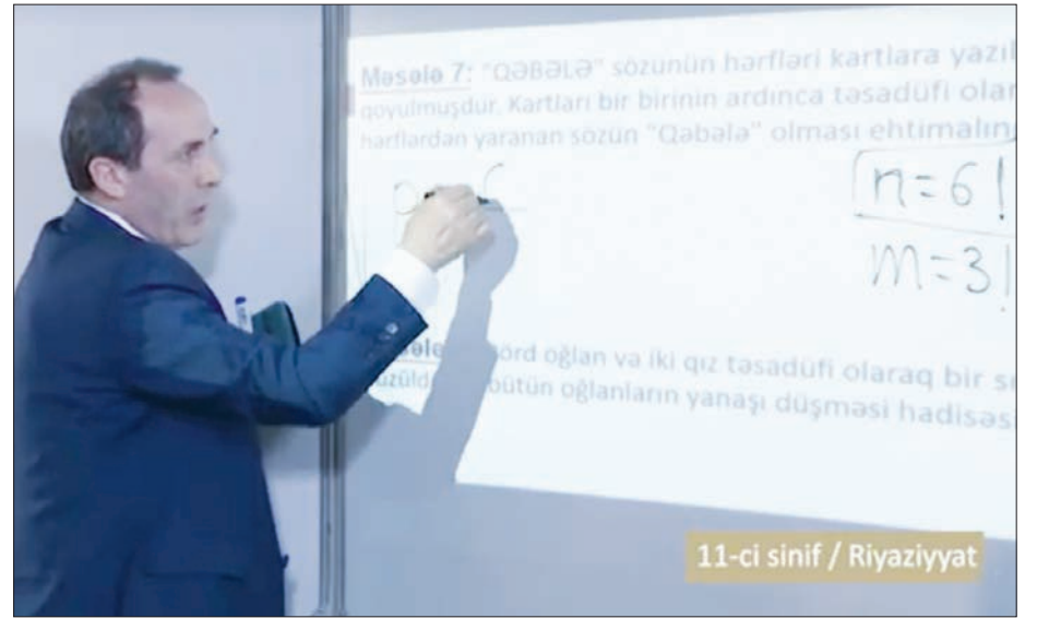
11-ci sinif / Riyaziyyat

“2019-2023-cü illər üçün ali təhsil sisteminin beynəlxalq rəqabətliyi artırılması üzrə Dövlət Proqramı”nın icrasına başlanılıb. Proqram çərçivəsində 5 beynəlxalq ikili diplom proqramının təsis olunması nəzərdə tutulub. Bunlardan 3-ü - Azərbaycan Dövlət Pedaqoji