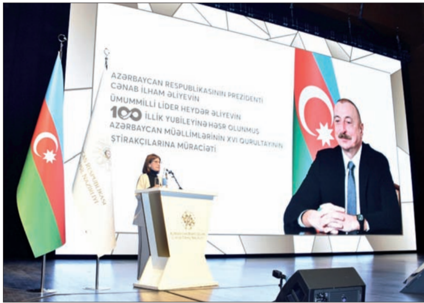
Əvvəli səh. 1