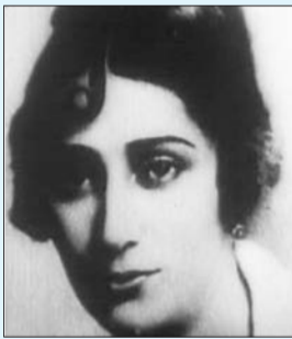
Şövkət MƏMMƏDOVA, SSRİ xalq artistkəsi

Azərbaycanda opera sənətinin banisi, istedadlı bəstəkar Üzeyir Hacıbəyovun ölümü xalqımız üçün böyük itkidir. Bu itki incəsənət işçiləri üçün daha ağırdır. Çünki biz incəsənət adamları hər gün, hər saat Üzeyir Hacıbəyovun qayğıkeş və mərəhbən atalıq məhəbbətini hiss edirik və duyuruq.