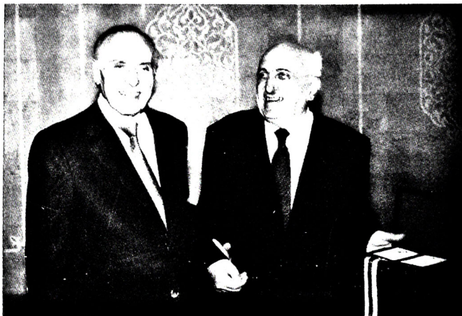
Şəkil 4. 6 iyul 2001-ci il. Prezident Heydər Əliyev mənə “İstiqlal” ordenini təqdim edir

Onunla görüşlərimizi mən tez-tez xatırlayıram. Həmişə mənə gülə-gülə qarşılayıb, gülə-gülə salamlayırdı. Onun mənə göstərdiyi böyük hörmətin təzahürləri – “İstiqlal” ordeni ilə təltif edilməyim barədə prezident fərmanı və 70 illik yubileyim münasibətilə ümumimilli liderimizin təbriki ömrümün sonunadək qəlbimi o böyük şəxsiyyətin xatirəsinə böyük ehtiram hissi ilə döyündürəcəkdir (şəkil 4).