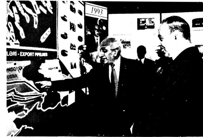
Şəkil 3. 13 iyul 1999-cu il. Heydər Əliyevin Azərbaycanda siyasi rəhbərliyinə gəlməsinin 30 illiyinə həsr olunmuş sərgidə

Sərgidə mən ulu öndərimizlə yenidən görüşdüm, SOCAR-ın ekspozisiyası barədə ona geniş məlumat verdim. Dedim ki, neft sənayemizin bugünkü və gələcək inkişafı üçün bünövrəni hələ SSRİ dövründə Siz qoymusunuz. Bu ekspozisiya da Sizin gördüyünüz misilsiz işləri əks etdirir. Sərgidə mən ulu öndərimizə bir daha inamla bildirdim ki, “Şahdəniz” yatağında 1 trln. m 3 -dən çox qaz var (şəkil 3).