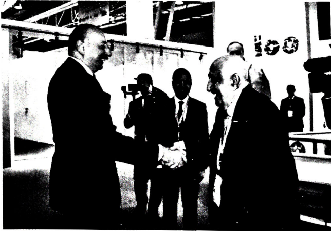
Şəkil 1. 31 may 2023-cü il. 28-ci Beynəlxalq “Xəzər Neft və Qaz” sərğisində

Son 30 ildə keçdiyimiz yola, gördüyümüz işlərə və əldə etdiyimiz nailiyyətlərə nəzər salanda Xəzər neft və qaz sərği – konfransının həm bizim üçün, həm də güman edirəm ki, sizin üçün əhəmiyyətini əyani şəkildə görürük. Bunun ən böyük əhəmiyyəti ondadır ki, bu konfrans dünyada neft və qaz işi ilə məşğul olan insanları bir yerə toplayır, onları görüşdürür, aralarında ünsiyyət yaradır, peşəkar söhbətlər üçün meydan açır. Bilirsiniz, biri var ki, bir-birimizlə qəzetlər, jurnallar və internet vasitəsilə tanış olaq, biri də var ki, üz-üzə əyləşib fikirlərimizi bölüşək, bir-birimizə işlərimizdən danışaq. Bunlar ayrı-ayrı şeylərdir və hesab edirəm ki, təmsil etdiyimiz ölkələrdə iqtisadiyyatın neft-qaz sektorunun ötən 30 ildəki inkişafında bizim bu cür görüşlərimizin böyük rolu olub. Bir-birimizdən biz çox şey öyrənmişik, əməkdaşlığımızı genişləndirmişik. Bu müddətdə Bakıda neft və qaz sahəsində nə qədər yeni müqavilə imzalanıb, nə qədər layihəyə həyat vəsiqəsi verilib! Mən hələ yeni texnika və texnologiyaların mübadiləsini demirəm. Bu müddətdə dünya dənizlərində və quruda tətbiq edilən müasir texnika və texnologiyaların əksəriyyətinin neft hasil edən ölkələrə yolu məhz bizim bu sərği-konfransdan başlanıb və bizə böyük uğurlar qazandırıb (şəkil 1).