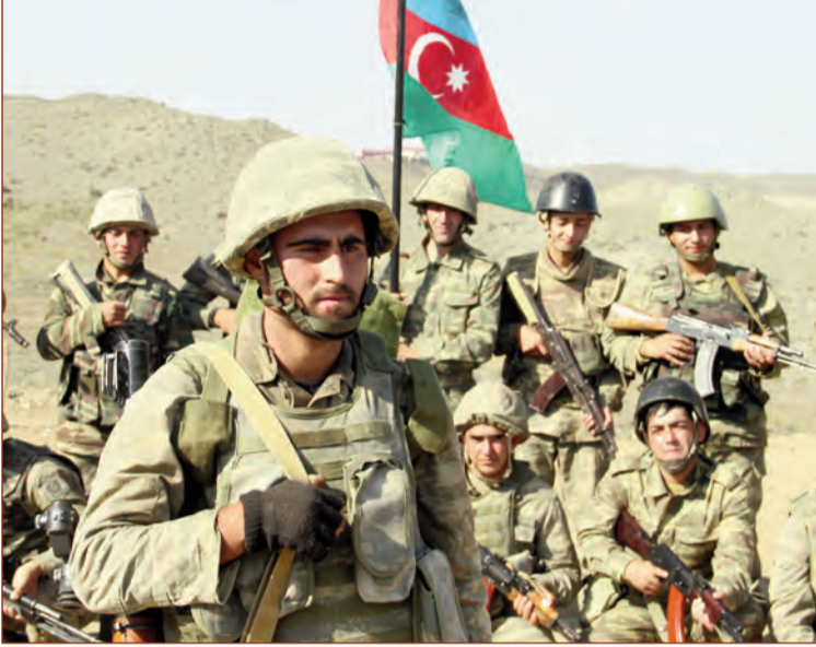
(Əvvəli 4-cü səhifədə)