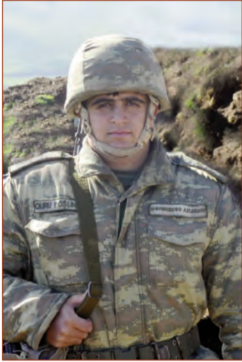
(Əvvəli 4-cü səhifədə)