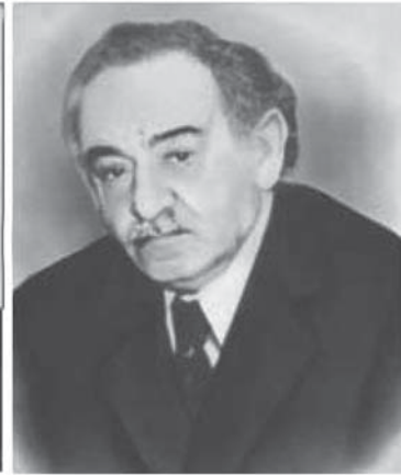
Akademik Həmid Arash