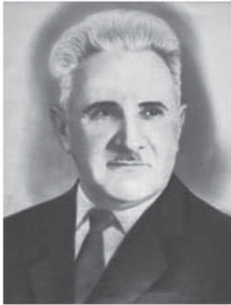
Akademik Əbdülkərim Əlizadə

Azərbaycan MEA Şərqsünaslıq İnstitutu (1967-1984-cü illərdə Yaxın və Orta Şərq xalqları institutu) 1958-ci ildə Respublika Nazirlər Sovetinin qərarı ilə EA-nın digər institutlarında fəaliyyət göstərən müvafiq şöbə və qrupların əsasında yaradılmışdır.