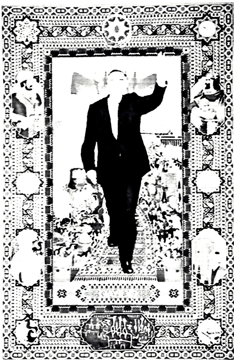
3. "Qayıdış" xalçası. Müəllif:Tahir Məcidov. 2002