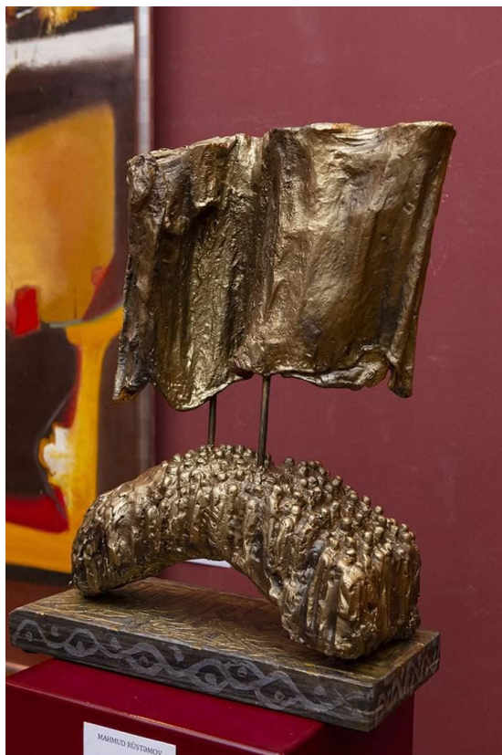
İll 4. Mahmud Rüstəmov “Qayıdış” (2021) (mərmər, bürünc)

Heykəltəraşlarımızdan Mahmud Rüstəmov “Qayıdış” ( ill 4) əsərində mərmər və bürünc materiallarını özünəməxsus formada həll etmişdir. Bir qrup insanın öz torpaqlarına qayıtması, milli ənənələrin yenidən Qarabağda yaşayacağına işarədir.