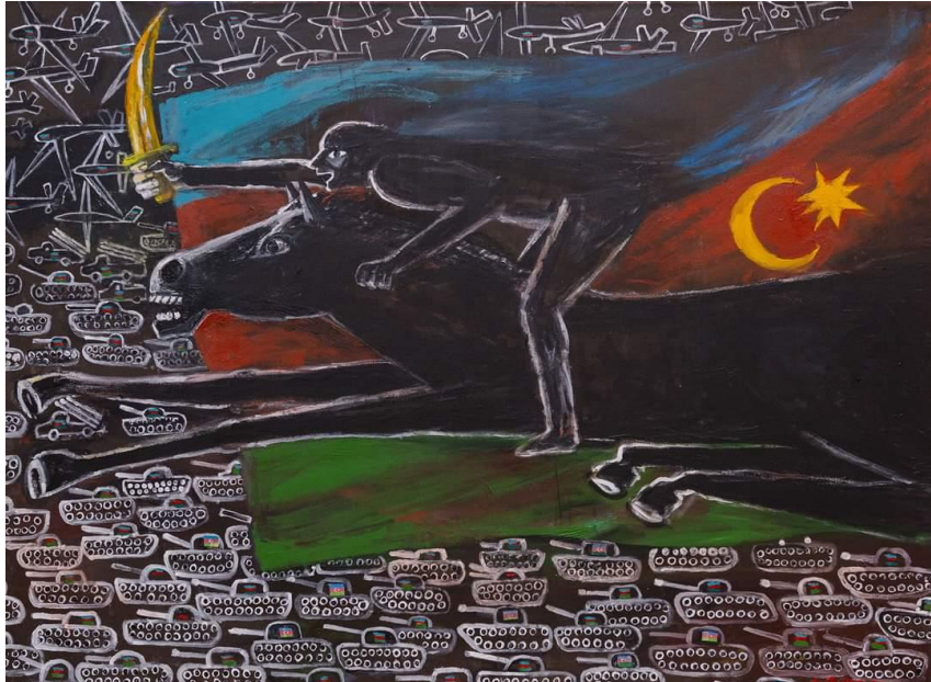
İll 2. Eldar Qurbanov “Marş irəli” (2021) (kətan, yağlı boya, 110x150 sm)

Ordumuz işğalda olan torpaqlarımızı azad etmək üçün dəmir yumruq kimi birləşdilər. Eldar Qurbanov “Marş irəli” (ill 2) əsərində tank, təyyarələr arasından güc simvolu sayılan atın üzərində əyləşən qəhrəman döyüşçü düşmən üzərinə hücumu keçir. Qılınc, ölkəsinin bayrağını müqəddəs sayan döyüşçü yadelli işğalçılara qarşı mübarizə aparır.