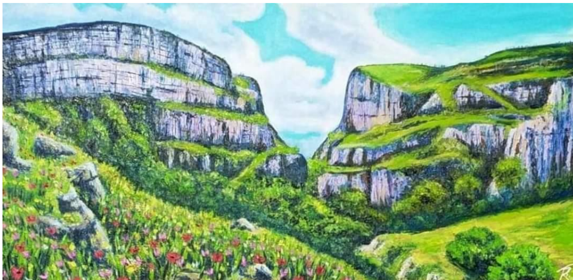
İll 3. Təhminə Əli “Topxana meşəsi” (2021) (kətan, yağlı boya, 60x120 sm)

Heykəltəraşlarımızdan Mahmud Rüstəmov “Qayıdış” ( ill 4) əsərində mərmər və bürünc materiallarını özünəməxsus formada həll etmişdir. Bir qrup insanın öz torpaqlarına qayıtması, milli ənənələrin yenidən Qarabağda yaşayacağına işarədir.