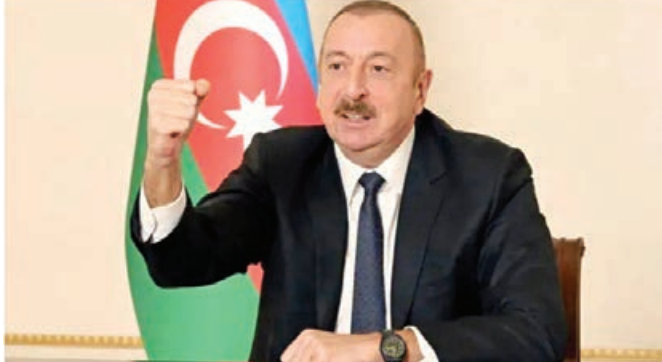
İlham Əliyev - Rəvni təqəcnəbəs fərməddəgəna şqəbələtı ərəzən, ştrəktqəvlelad mənəmşqəvleqəş gəvleddə ərəzəməm - şəvleqleddə gəvleddə şəkərvleqəş ərəzəqəvəməm gəvleddəvleqəş şqəvleddə

Məqalədə həmçinin Azərbaycan Prezidentinin "...düşünürəm, biz sülhə götürmüşük. Biz sülhü müharibə ilə gətirdik. Düşünürəm ki, bu, Qafqazda lokal vəziyyətdən daha geniş şəkildə qiymətləndiriləməli olan bir məsələdir. ...biz sübut etdik ki, münəqışənin hərbi yolla həlli var. Beləliklə, münəqışə həll olundu" fikirləri oxuculara təqdim olunub.