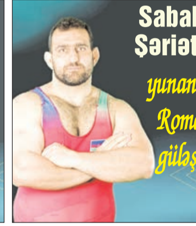
Sabah Şəriəti yunan- Roma gülaşi