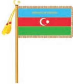
Şəkil 1. Polis Akademiyasının Bayrağının üz tərəfi

Qumaşın üz tərəfi "Azərbaycan Respublikası Dövlət Bayrağının təsvirinin təsdiq edilməsi haqqında" Azərbaycan Respublikası Konstitusiyaya Qanununun tələblərinə uyğun olaraq, Azərbaycan Respublikası Dövlət Bayrağının təsviri ilə eynidir, lakin mavi zolağın ortasında qızılı rəngli ipək sapla "AZƏRBAYCAN UĞRUNDA" sözləri yazılır. Yazıdakı hərflərin hər birinin hündürlüyü 4,5 sm, eni 3,3 sm-dir (Şəkil 1).