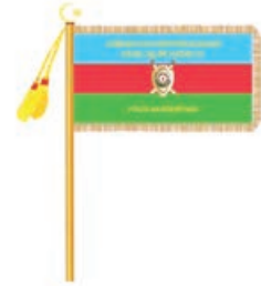
Şəkil 2. Polis Akademiyasının Bayrağının arxa tərəfi

Qumaşın arxa tərəfində mavi zolağın ortasında qızılı rəngli ipək sapla "AZƏRBAYCAN RESPUBLİKASININ DAXİLİ İŞLƏR NAZİRLİYİ", yaşıl zolağın ortasında "POLİS AKADEMİYASI" sözləri, qırmızı zolağın ortasında isə Azərbaycan Respublikası Prezidentinin 2004-cü il 30 iyun tarixli 82 nömrəli Fərmanı ilə təsdiq edilmiş "Azərbaycan Respublikası daxili işlər orqanlarının embleminin təsviri"nin tələblərinə uyğun hündürlüyü 35 sm olan Azərbaycan Respublikası daxili işlər orqanlarının emblemi tikilir. Yazılardakı hərflərin hündürlüyü 4,5 sm, eni 3,4 sm-dir (Şəkil 2).