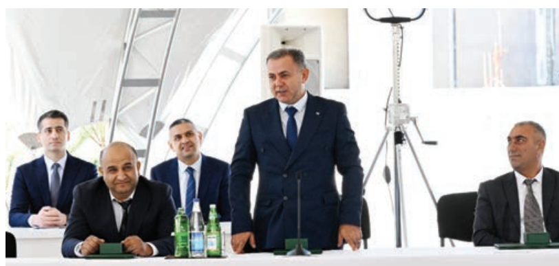
Əvvəli 3-cü səh.

Sonra çarların təqdim edilməsi mərasimi oldu.