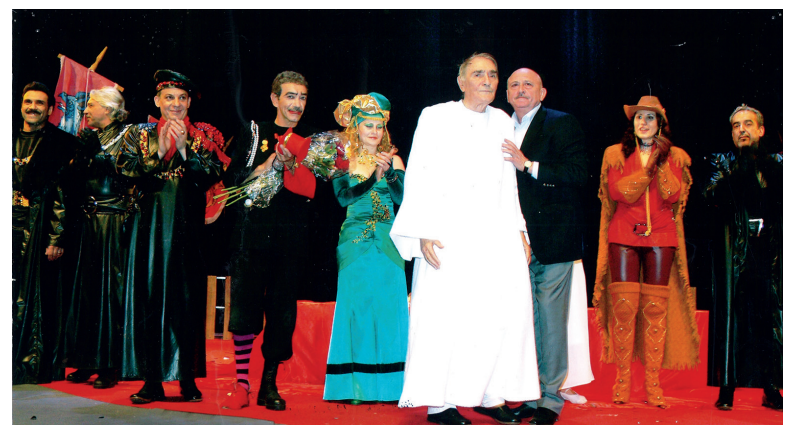
«Король Лир» с Нодаром Шашикоглу

ко у каждого большого режиссера свое видение мира, своя психологическая установка. Отнесемся же к этому с пониманием. В конце концов, у талантливого человека всегда есть собственное тщеславие. Просто не каждому удается его сполна реализовать. Думаю, что Шаровскому это удалось.