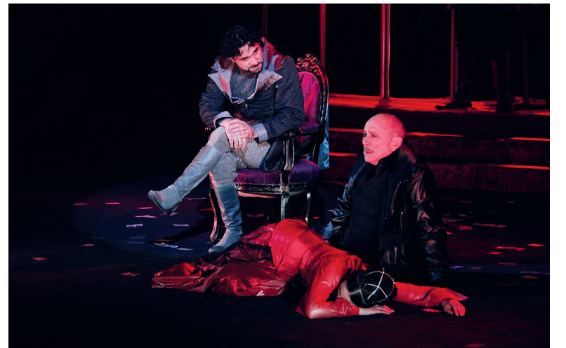
Арбенин в драме «Маскарад»