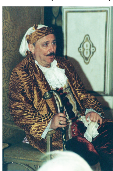
«Мнимый больной» Мольера