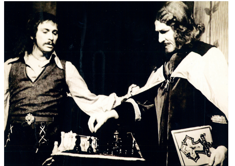
«Д'Артаньян и три мушкетера», 1976 год