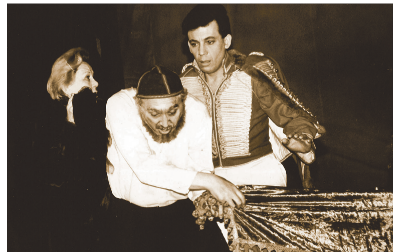
Мендель Крик в «Закате»