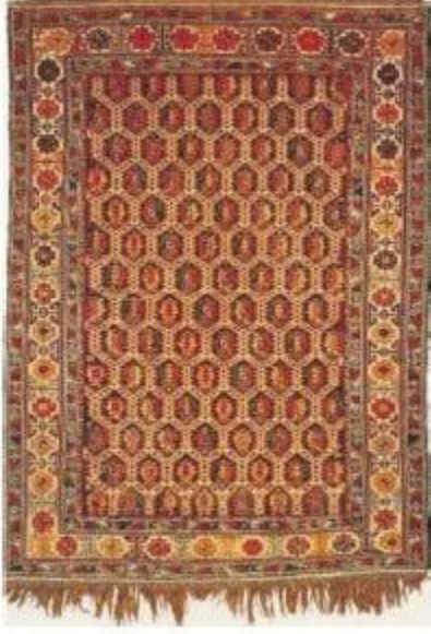
İLL 4. “Şilyan” xalçası