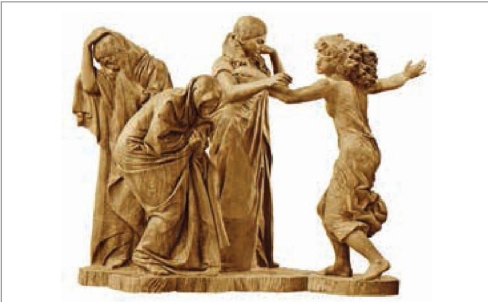
İLL 3. Ömər Eldarov “Zamanın dörd rəngi”

5.İnteqrativlik. Bu kurikulumun prinsipi zamanı təsviri sənət müəllimi təhsilin məzmun komponentlərini bir-biri və həyatla sistemli şəkildə əlaqələndirməlidir. IX sinif şagirdlərinə Ömər Eldarovun “Zamanın dörd rəngi” əsərini təqdim edən müəllim insanın gənclikdən, qocalığa qədər olan həyat yolunu danışaraq əsər barəsində fikirlər söyləyir.Digər fənlərlə inteqrativlikdə isə təsviri sənət daha çox tarix, ədəbiyyat, musiqi və texnologiya ilə qarşılaşdırılır.