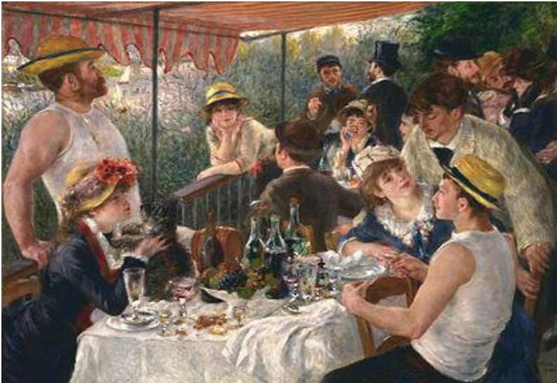
İLL 1. Ogüst Renuar “Avarçəkənlərin səhər yeməyi”

1.Şagirdyönümlülük: Bu prinsipi təsviri sənət fənninin tədrisində nəzərə alsaq, şagirdlərin istedad və qabiliyyətlərinin, potensial imkanlarının inkişafı ön plana çıxarılır. Təsviri sənət fənnində şagirdyönümlülük prinsipi əsasən rəng, süjet, obraz və əsərlərin səhnələşdirilməsi əsasında qurulur. VIII sinif şagirdləri üçün Ogüst Renuarın “Avarçəkənlərin səhər yeməyi” əsərinin təhlilini keçəndən sonra müəllim səhnələşdirərək daha da maraq oyatmalıdır.