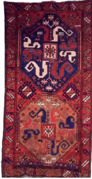
İLL 5. “Malıbəyli” xalçası

Prosedural bilik. Təsviri sənət fənnində bir şeyi necə etmək haqqındakı, başqa sözlə, müəyyən tapşırıqın icrası üçün lazım olan bilikdir. Əsasən bacarıq, alqoritm, texnika, metod, müvafiq prosedurlardan yerində istifadə etmək meyarı kimi fəaliyyət ardıcılıqlarını özündə birləşdirir. Bu bilik uzun müddət şagirdlə işlənildikdən sonra avtomatikləşir. Təsviri sənət müəllimi şagirdlərdə əsərləri təhlil etməyin yol, üsul, metod ardıcılıqlarını düzgün, dəqiq və aydın başa salmalıdır. VIII sinif təsviri sənət fənnində “Jak Lui David: tarixi obrazlar” mövsunda müəllim məşhur fransız rəssamın “Horatsilərin andı” əsərini şagirdlərə təqdim edib, ardıcıl formada təhlil üzərində işləməlidir.