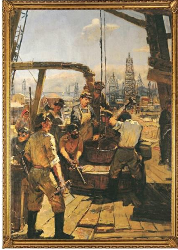
İLL 1. Böyükəğa Mirzəzadə “Neft mədənlərində” (1946)

“Fuad Əbdürrəhmanov:dəzgah və monumental heykəltəraşlıq” mövzusunda inklüziv şagirdlər plastilindən kiçik fiqurlar işləyirlər. Müəllim inklüziv şagirdlərə daha sonra Fuad Əbdürrəhmanovun müəllifi olduğu tanınmış şəxsiyyətlərin heykəllərinin fotolarını göstərib materialları göstərə bilər.