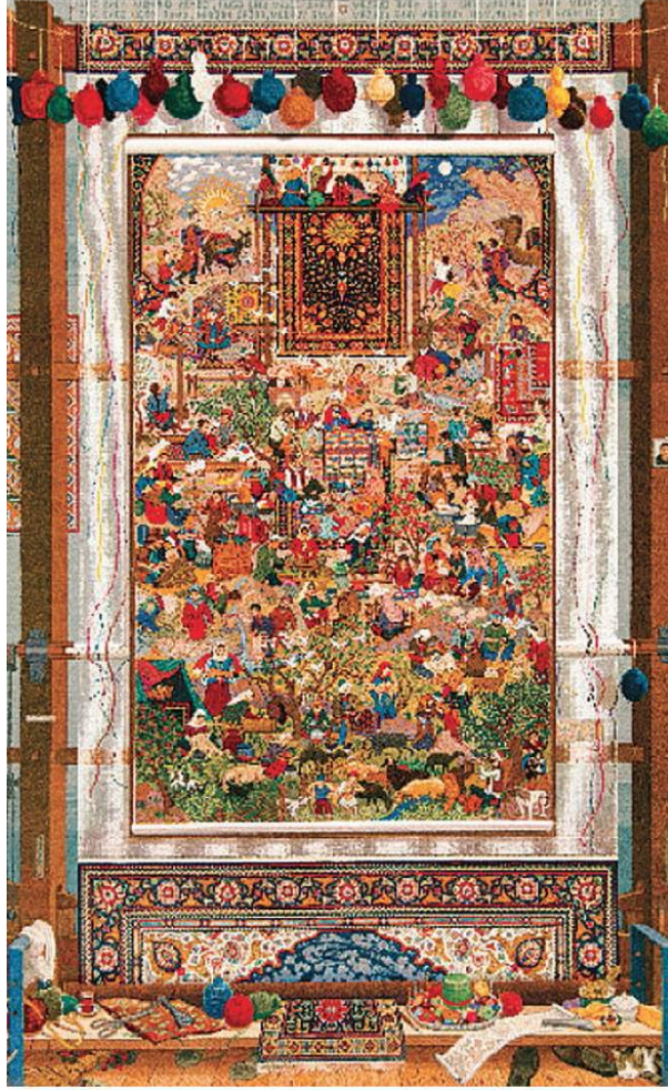
İLL 4. Eldar Mikayilzadə “Yaranış” (2010)

VIII sinif inklüziv şagirdlərə təsviri sənət fənnində Azərbaycan incəsənətinin öyrədilməsi onların dünyagörüşünü artırmaqla bərabər, həm də öz ölkəsinin incəsənətini öyrənir.