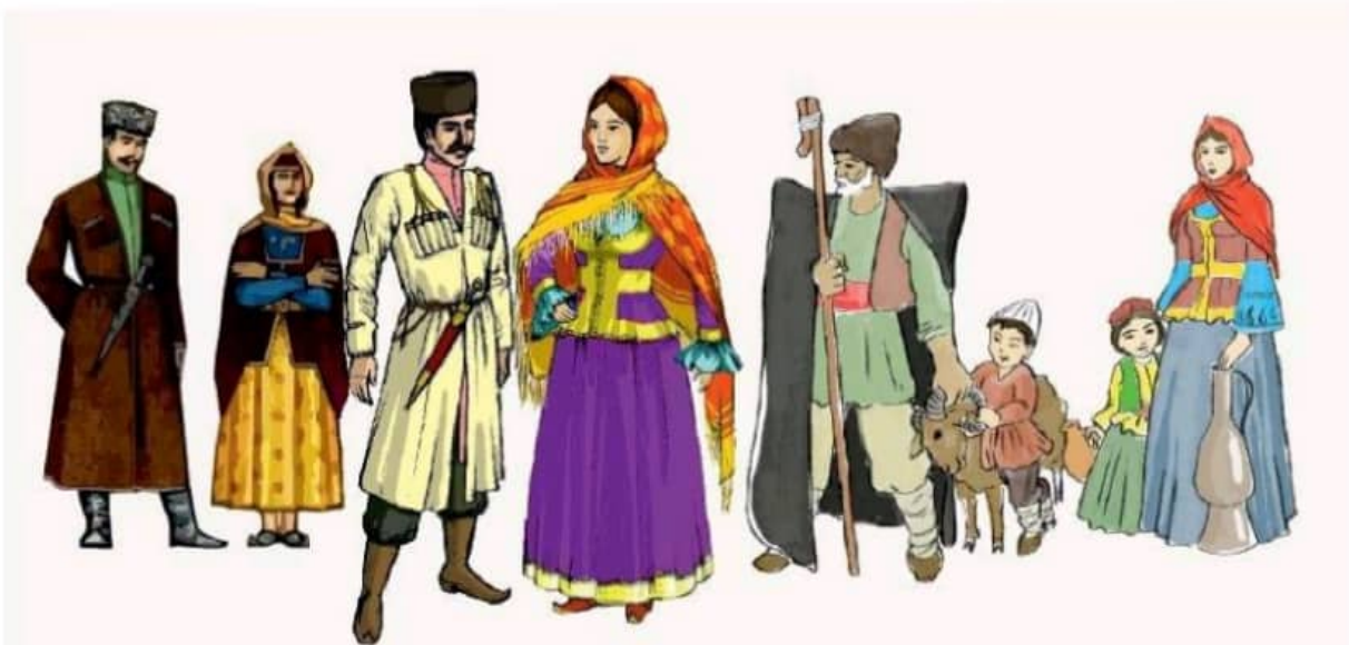
İLL 1. Xalq geyimləri

f.Albom vərəqində kişi geyimi işləyə bilərsinizmi?