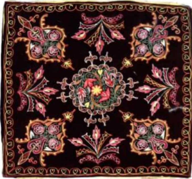
İLL 2. Təkəlduz

3. Təsviri sənət fənninin tədrisi metodikasında şagirdlərin əldə etdiyi bilik və bacarıqların nəticələnməsi. Hər bir fəndə olduğu kimi təsviri sənətin hər bir dərslərin sonunda esse, layihələr, hesabatlar formasında nəticələr təqdim edilə bilər. Şagirdlər hər bir dərslərin sonunda layihələri aşağıdakı formada təqdim edirlər: