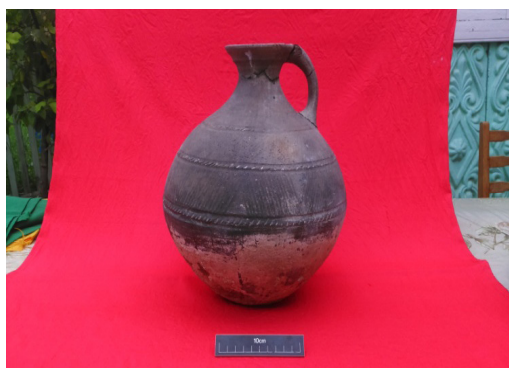
Şəkil 9. Bardaq (3 №-li qəbir)