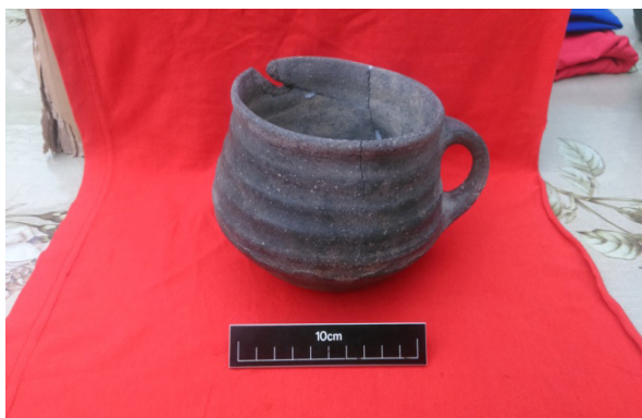
Şəkil 7. Parç

Qəbir kamerasının şərq küncündəki insan kəlləsinin ətrafından mavi, ağ və yaşıl rəngli pasta muncuqlar aşkar edildi. Bundan əlavə, qəbir kamerasında 2 ədəd dəmir xəncər, 9 ədəd gil qab tapıldı ( şəkil 6 ). Gil qablar qazan, boşqab, parç ( şəkil 7 ), 2 küpə, vaza ( şəkil 8 ), bardaq ( şəkil 9 ), 2 ədəd xeyrə tipli gil qablardan ibarət idi. Dəmir xəncərlər eyni uzunluqda (23 sm) olub, eyni formada idilər.