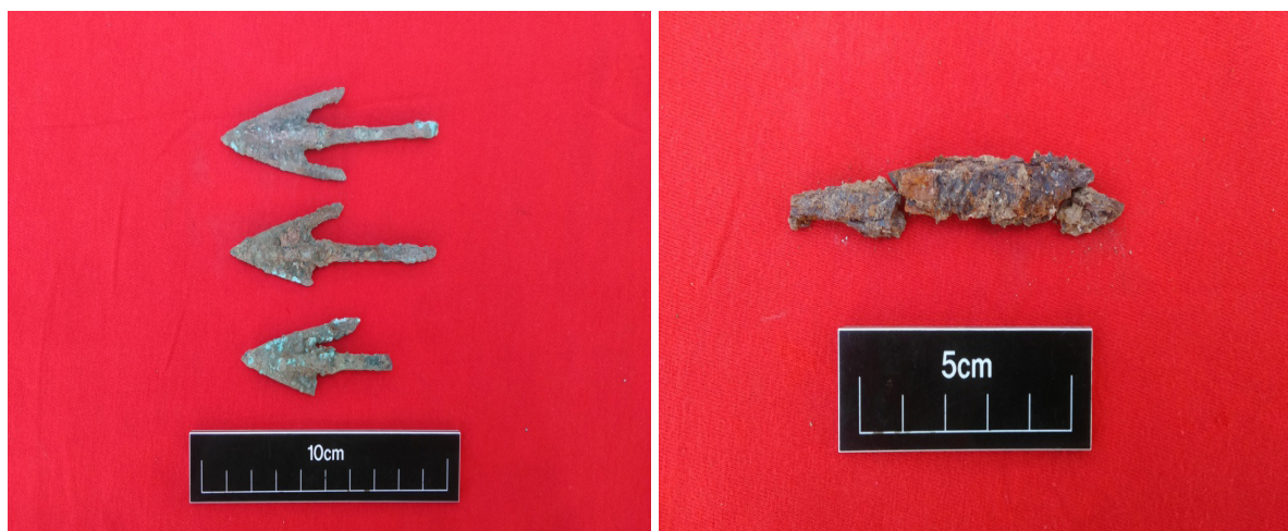
Şəkil 4-5. Cənubi Qafqaz tipli qanadlı tunc ox ucluqları və dəmir xəncərin qalıqları (2 №-li qəbir)

50 sm dərinlikdə aşkar edilən qəbir kamerasının ölçüləri 1,8x1,9 m olub, 4-cü kvadratdan aşkar edildi. Qəbir kamerası kvadratın şimal divarından 40 sm aralıda yerləşirdi. Narın torpaqla doldurulmuş qəbir kamerası təmizlənərkən sümükləri tamam çürümüş vəziyyətdə olan insan skeleti aşkar edildi. Kəllə sümükləri və qabırğaların bəzisi qismən yaxşı vəziyyətdə idi. Sümüklərin torpaqda qalmış izlərindən müəyyən etmək olurdu ki, meyit qəbirdə qərb-şərq istiqamətində basdırılıb [1, s.13]. Skeletin ətrafından 2 ədəd gil qab, əqiq muncuq, 3 ədəd tunc ox ucluğu, 1 ədəd dəmir məmulat (ehtimal ki, xəncər qalığı) ( şəkil 5 ), tuncdan bəzək əşyası aşkar edildi. Gil qabların hər ikisi dağılmış vəziyyətdədir. Ox ucluqları isə sallaq qanadlı olub Cənubi Qafqaz tiplidir ( şəkil 4 ).