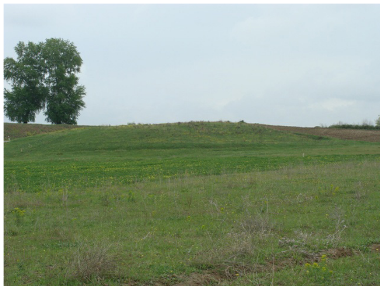
Şəkil 1. Əziztəpə abidəsinin şimaldan görünüşü

Qazaxbəyli kəndi ərazisində, Bakı-Tiflis magistral yolunun sağ tərəfində, kənddən 450-500 metr şərqdə, N41°09'40.5» E45°19'34.5», N41°09'44.9» E45°19'36.7» və N41°05'41.3» E 45°15'36.9» koordinatlarında, dəniz səviyyəsindən 354 metr yüksəklikdə yerləşir (şəkil 1).