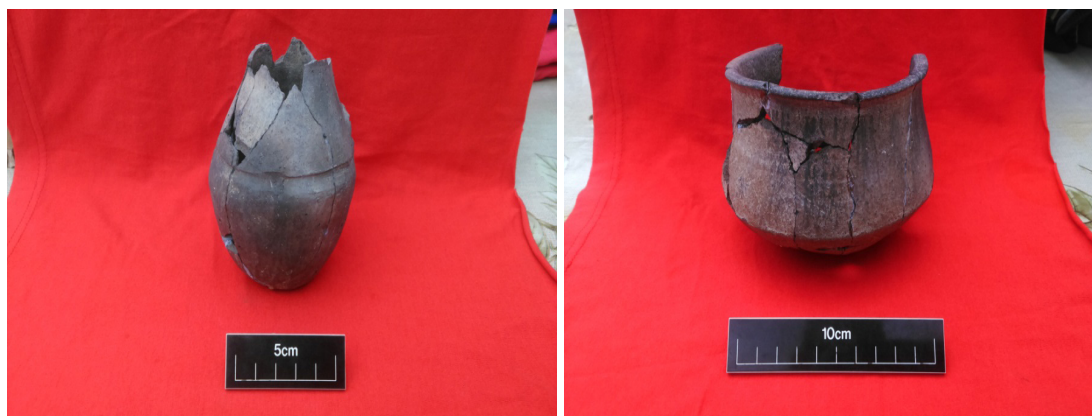
Şəkil 10-11. Gil qablar (4 №-li qəbir)

Bu qəbir qazıntı sahəsinin 4-cü kvadratına düşürdü. Torpaq qəbir yer səthindən 65 sm dərinlikdə aşkarlandı. Qəbir kamerasında insan skeleti aşkar edilmədi. Ehtimal ki, skelet ya tamamilə çürümüş, ya da əkin işləri zamanı texnika tərəfindən məhv olunmuşdur. Qəbir kamerasının ölçüləri 80x60 sm idi. Qəbir kamerasında yalnız iki ədəd gil qab aşkar edildi. Onlardan biri kiçik həcmli dopu, digəri isə parç idi (şəkil 10-11). Qabların hər ikisi yarımdağılmış halda olsa da, yerindəcə ölçülərini götürmək mümkün oldu [1, s.14].