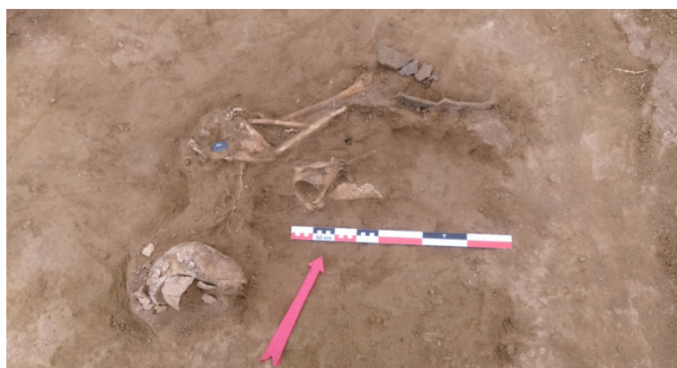
Şəkil 12. İnsan skeletinin qalıqları (5 №-li qəbir)

Torpaq qəbir 65 sm dərinlikdən aşkar edildi. Qəbir 4-cü kvadratdan tapıldı. Qəbir kamerasının torpağı ətrafın gilli bərkimiş torpağından seçilirdi. Qəbir kamerası 1,7x2 m olub, zəngin deyildi. Kamerada aşkarlanan insan skeletinin sümükləri xaotik vəziyyətdə idi. Burada parçalanaraq dəfn etmə ayininin izləri müşahidə olunurdu (şəkil 12). Kəllə üzüstə torpaqda qalmış, onurğa sümükləri dağılmış, çanaq və bud sümükləri kəllənin yanından tapılmışdı [1, s.14-15]. Alt çənə yox idi. Çiyin sümükləri təmizlənən zaman bir ədəd dəmir ox ucluğu tapıldı. Ehtimal etmək olardı ki, bu, döyüşçü olmuş, hərbi əməliyyat zamanı çiyindən oxla yaralanmış və yerində çabalayaraq ölmüşdür. Bir müddət sonra onun meyiti tapılmış və elə bu vəziyyətdə də basdırılmışdır. Qəbir kamerasında yalnız bir ədəd xeyrə tipli gil qab aşkar edildi.