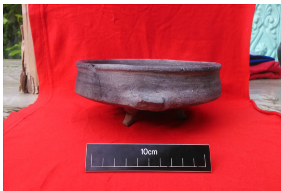
Şəkil 8. Vaza tipli gil qab