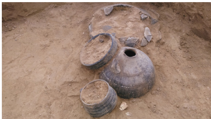
Şəkil 6. 3 №-li qəbirdəki gil qabların düzülüşü

da, onu təmizləmək və torpaqdan götürmək mümkünsüz idi. Ona görə də qismən təmizləyib ölçülərini götürdük. Salamət qalmış diş nümunələri isə analiz üçün qablaşdırıldı [1, s.14].