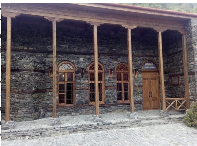
Şəkil 4. Qax rayonunun Sarıbaş kəndində 2019-cu ildə bərpa və təmir edilmiş məscid

Türk tədqiqatçıların qənaətlərinə əsasən, “sarıbaş” sözünün mənası (“sarı”, “sari” türk sözləri olub, rəng mənasını bildirir) həm də “tərəf”, “istiqaət” deməkdir. Bu məzmununda “sarıbaş” sözü “başa tərəf”, “baş tərəf” anlamları ilə də uyğun gəlir. Türk xalqlarında “sarı başlı” ifadəsi ilə həm də igid, qəhrəman kəs nəzərdə tutulmuşdur [9, s.303]. Bu adla Şəki rayonu ərazisində Sarıqaya, Kəlbəcər rayonunda Sarıyer oronimləri işlənir [5, s.58-59]. Ukraynanın Kırım Muxtar Vilayətində eyniadlı kənd vardır.