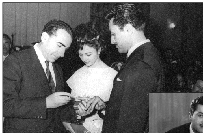
23 aprel 1965 tarixində evləndim. Üzüklərimizi Alparslan Türkeş taxdı

kək çocuq dünyaya gətirmiş. Ancaq bu çocuqlar kiçik yaşlarda ölmüşlər. Şimdi həyatda üç qardaş varız. Ablam Şükran Orbay məndən beş yaş böyükdür. Erkək qardaşım Naci Ba-