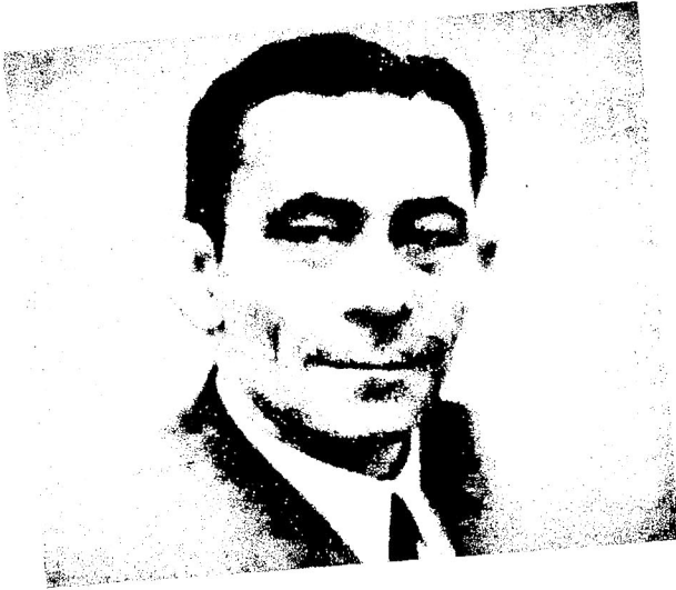
Cahid Sıtkı TARANCI