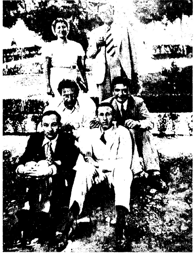
Orhan Veli, Sabahattin Eyüboğlu, Necati Cumalı, Azra Erhat, Nurullah Ataç