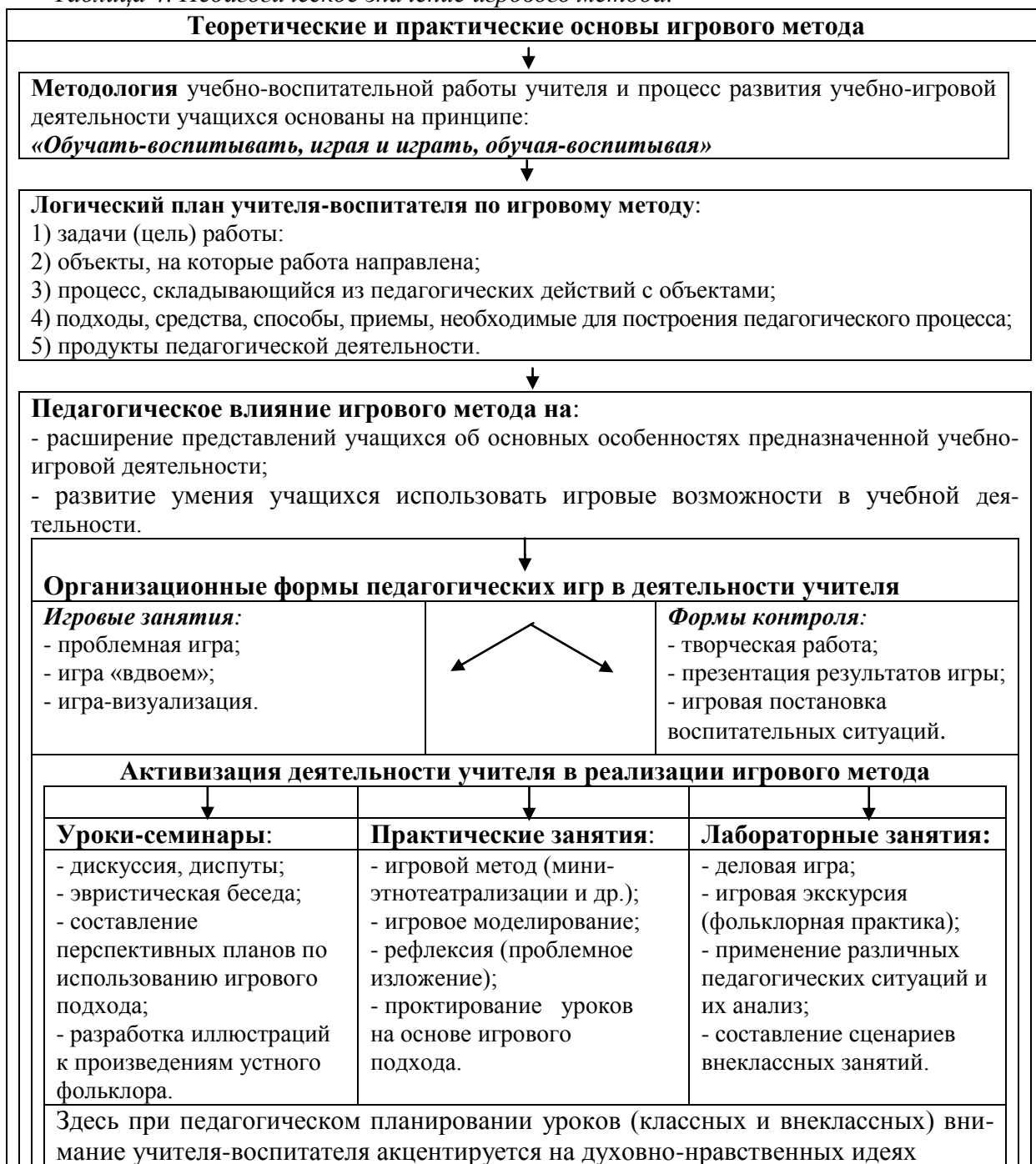
Таблица 4. Педагогическое значение игрового метода.

Преобразование игры в игрового метода показывается в его методических особенностях, придающих ему педагогическую значимость (таблица № 4).