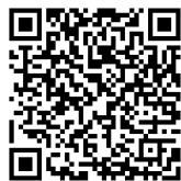
Şəkil 4: Atların yarış tapşırığının QR kodu

Prinsipcə yanaşsaq, şagirdlər üçün bu gün İKT-dən istifadə edərək müxtəlif dərslər hazırlamaq heç də çətin deyil, şagirdlərdə rəqəmsal qabiliyyətlər güclüdür. Onlar üçün nə müxtəlif redaktor və prosessorlarla işləmək, nə internet resurslarından istifadə, nə də kompüter testi yeni və qaranlıq sahə deyil. Şagirdlər bütün bunlarla informatika dərslərində tanış olur, burada həm müəyyən İKT-nin imkanları, həm də konkret praktiki bacarıqlar haqqında təsəvvür əldə edirlər.