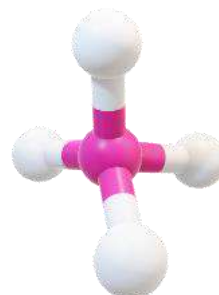
Şəkil 1: Metan molekuluğunun 3D quruluşu

s.) hazırlamaq üçün müvafiq prosessor və redaktorlardan istifadə edərək mətn, rəqəmsal, qrafik və səs məlumatlarını emal edə bilər. Nümunə: