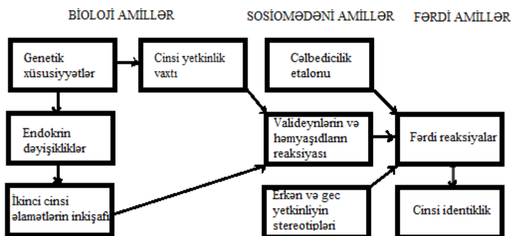
Sxem 2. Cinsi identikliyin formalaşmasının amilləri və mexanizmləri [7]

Gender rolları – tarixi, sosial-mədəni irsdən irəli gələn gender stereotipləri əsasında kişi və qadınların davranışlarının qəbul olunmuş norma və modellərinin vəhdətidir. Bu norma və modellər təhsil sisteminin bütün sahələrində aşkar olunur. Pedaqoqların və təhsil menecerlərinin davranışlarında, dərsliklərin məzmununda bunu müşahidə etmək mümkündür.