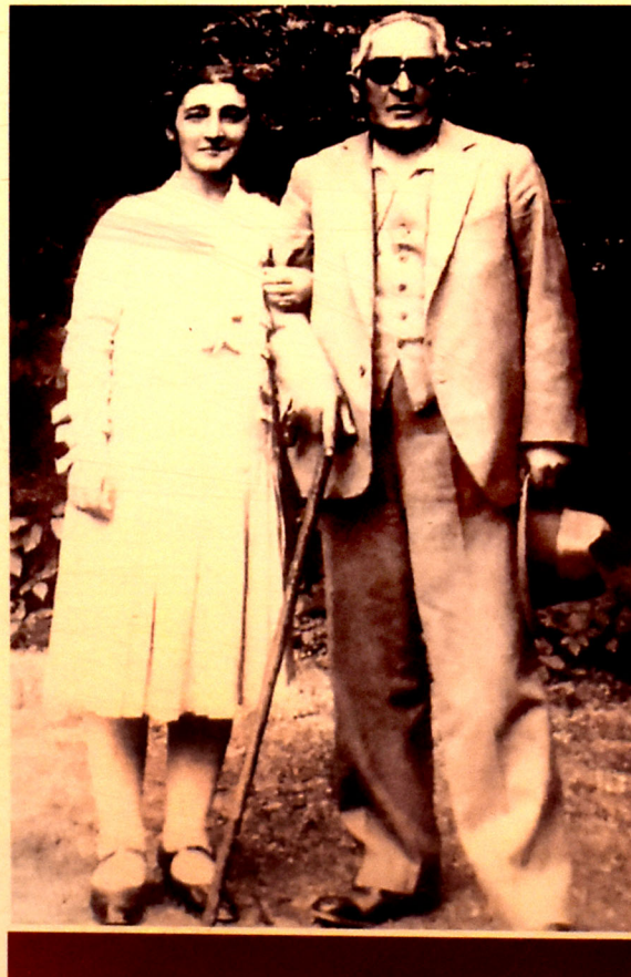
• Əhməd bəy Ağaoğlu və həyat yoldaşı Sitarə xanım

1922-ci ildə Əli bəy Hüseynzadəyə ünvanladığı başqa bir məktub həm iki böyük tarixi şəxsiyyət arasındakı münasibətlə-