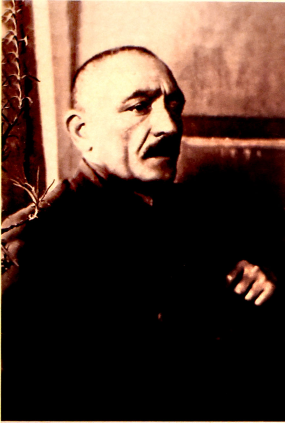
• Əhməd bəy Ağaoğlu sürgündə

“ Əhməd bəy Ağaoğlunun epistoloyar irsi: böyük mütəfəkkir, yazıçı, publisist, dövlət xadimi, istiqlal mücahidinin həyat və fəaliyyətinin daha dərinədən təhlili və dəyərləndirilməsi, ağaoğluşünaslığın inkişafı üçün zəngin və mötəbər materialdır...”