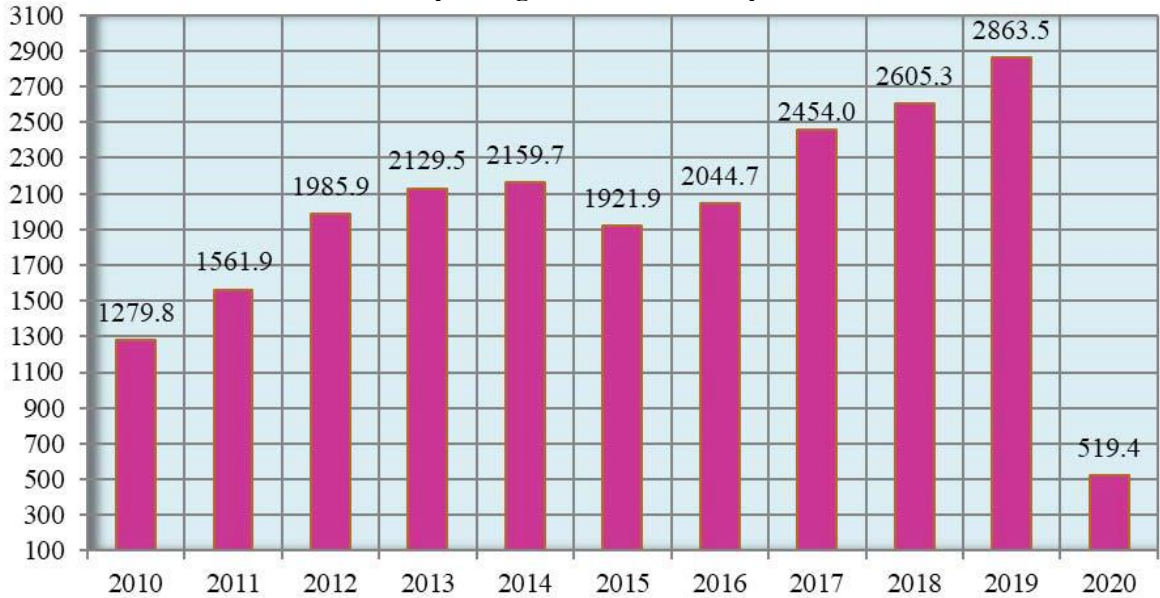
Qrafik 1. Azərbaycana gələn turistlərin sayı, min nəfər

Koronavirus pandemiyasından əvvəlki beş ilin təhlili də göstərir ki, turizm sektoru Azərbaycan iqtisadiyyatında öz mövqeyini gücləndirir və perspektivli sahələrdən biridir. Rəsmi məlumatlara görə, 2016-cı ildən Azərbaycana gələn turistlərin sayı dinamik şəkildə artmaqdadır. Belə ki, 2015-ci ildə Azərbaycana gələn turistlərin sayı 2014-cü illə müqayisədə 11 faiz azalsa da, 2016-cı ildə müsbət artım əldə edilib. 2015-ci illə müqayisədə 2016-cı ildə ölkəyə gələn turistlərin sayı 6,4 faiz artıb. 2019-cu ildə ölkəyə gələn turistlərin sayı 2015-ci illə müqayisədə 49 faiz artıb.