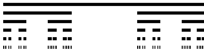
Şəkil 1. Kantor çoxluqları