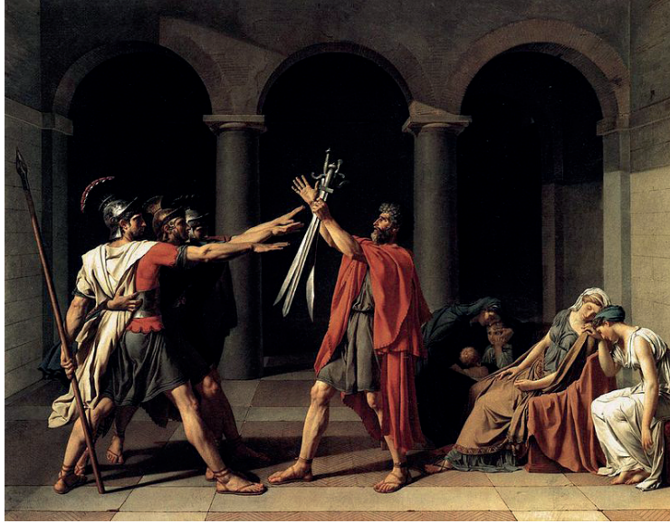
İLL 3. Jak Lui David "Horatsilərin andı"

qoca onların döyüşünə xeyir-dua verir. Həmçinin mövzuda şagirdlər rəssamın pərəstiş etdiyi Napoleon Bonaparta həsr edilən silsilə əsərləri də izləyir.