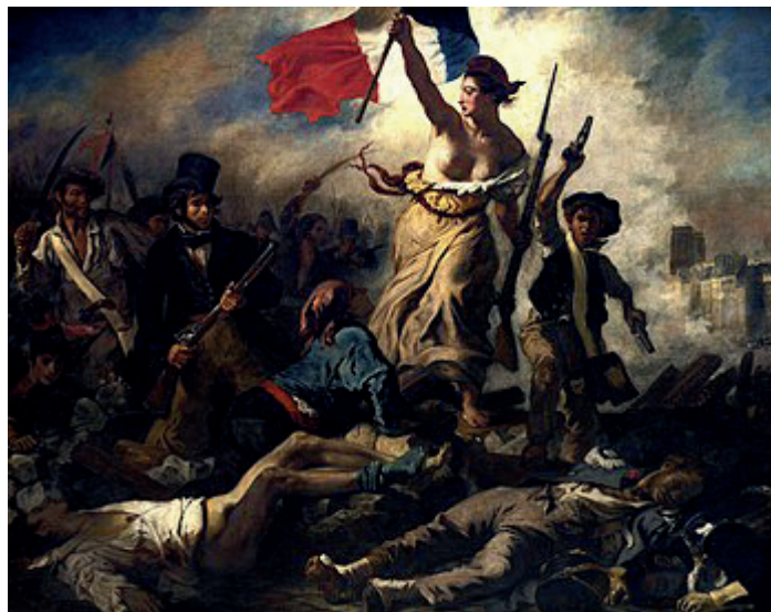
İLL 5.Ejen Delakrua “Azadlıq barikadaları”

Dərslıkdə növbəti mövzulardan biri Ejen Delakrua yaradıcılığının təhlilidir. XIX əsrin romantik rəngkarlığı haqqında şagirdlərdə daha dolğun təsəvvürün yaranması üçün tarixi janrın inkişafında misilsiz rol oynamış rəssamın əsərlərinə xüsusilə müraciət edilmişdir. Ejen Delakrua - Fransa tarixində müxtəlif hadisələrin süjetləri əsasında çoxlu sayda möhtəşəm tablolar çəkmiş dahi rəssamlardan biridir. Şərq, orta əsrlər və Fransa inqilabı onu eyni dərəcədə ilhamlandırır. Həmçinin rəssamın “Dantenin qayığı” və “Azadlıq barikadaları” əsərlərinin təhlili şagirdlərə təqdim edilir.