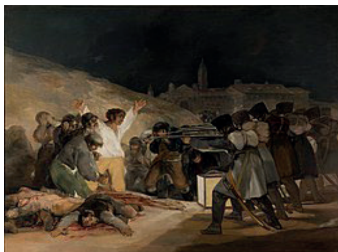
İLL 2.Fransisko Qoyya "1808-ci ilin mayın 3-də üsyançıların güllələnməsi"

"Fransisko Qoyya:rəssamın rəng dünyasına həyat hadisələrinin təsiri" mövzusunda böyük ispan rəssamının tarixi janrda işlədiyi qrafika və rəngkarlıq əsərləri təhlil edilir. Qoyyanın iki məşhur tablosundakı Madrid üsyanı və rəssamın İspaniyaya görə hiss etdiyi qəlb ağrısı, müharibə və qırğınlara qarşı üsyanı və etirazı əks olunub.