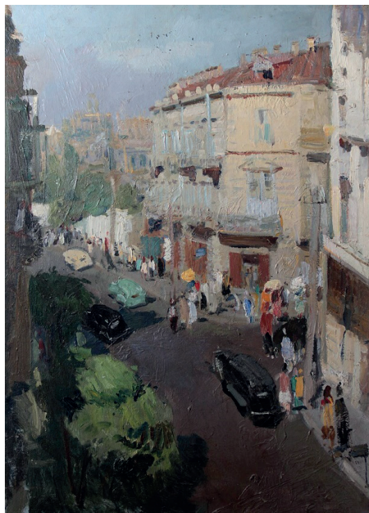
İLL 1. Böyükağa Mirzəzadə "Bakı mənzərəsi"

xalq rəssamı Böyükağa Mirzəzadə yaradıcılığını şagirdlərə öyrətdikdən sonra, mənzərə janrında işlədiyi əsərləri seçməyi tapşırmaqla həm də mövzular arasında inteqrasiya edir. Bütün bu proses zamanı isə şagirdlər başqalarını diqqətlə dinləməlidir.