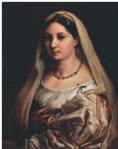
İLL 3. Rafael Santi