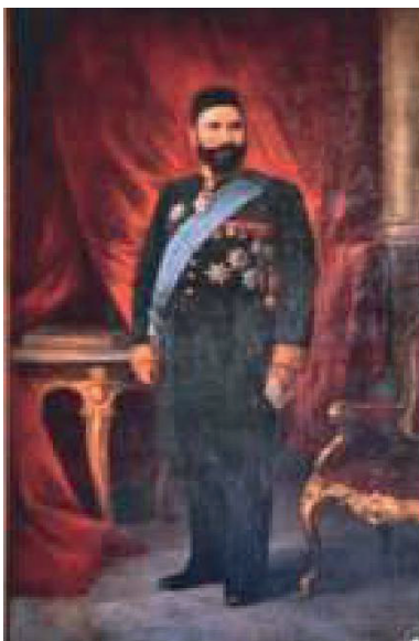
İLL 2. İsaak Brodski

tapşırıq kimi verməlidir. Müəllim şagirdlərə müstəqil işləyərkən və ya qrup fəaliyyətində qərar verərkən hərtərəfli düşünməsini inkişaf etdirməlidir.