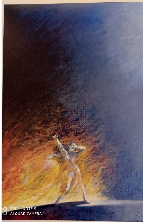
İLL 5. V.Ucatay “Fəryad” (1992) (kətan, yağlı boya, 150x100 sm)

“Fəryad” (ill 5) əsərində Xocalı faciəsində yandırılan qadınların düşmən qarşısında əyilməyərək, mənlük simvoludur. Ermənistanın gücsüz insanlara qarşı törətdiyi soyqırımı bu əsərdə dünyaya çatdırır.