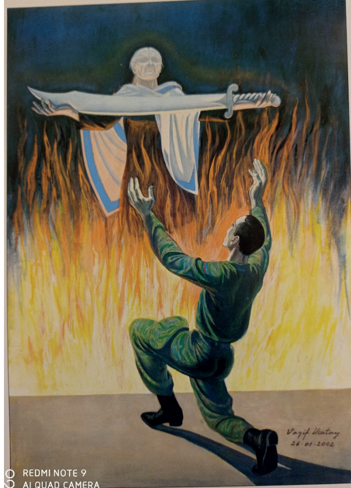
İLL 6. V.Ucatay "Müqəddəs qisas" (2002) (kağız, tempera, 48x30 sm)

Vaqif Ucatay 2002-ci ildə təsvir etdiyi əsərində alovlar içində yanan Xocalı qadının əlindəki xəncər hələdə onun ruhunun sakit olmadığını göstərir. Əsgər ana qarşısında diz çökərək qisas alacağını and içir və öz sözlərinə sadıq çıxan ordumuz 2020-ci ildə 44 günlük müharibədə ermənistan ordusunu məhv edir. (ill 6)