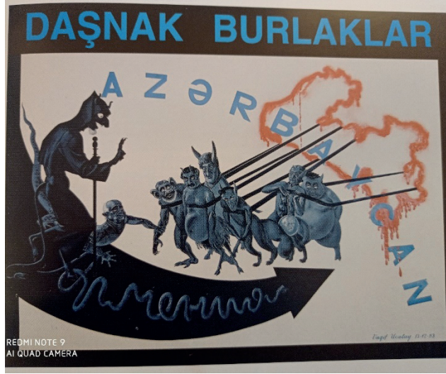
İLL 2.V.Ucatay "Daşnak burlaklar" (1993) (kağız, tempera, tuş, 80x96 sm)

"Daşnak burlaklar" əsərində erməni daşnaklarının dövlət nümayəndələri şeytan cildində Azərbaycana hücum edir. (ill 2)