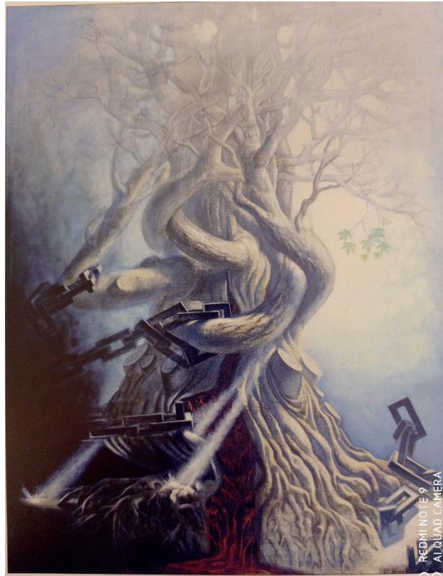
İLL 3. V.Ucatay "Zor gücsüzlüyü" (1998) (kətan, yağlı boya, 91x70 sm)

Azərbaycan 90-cı illərdə müstəqillik əldə etdikdən sonra ərazilərinin itirilməsi kimi çətin təhlükə ilə üz-üzə qaldı. Daima çiçək açan, budaqlanan ağac bir anda zəncirlənir, yaralanır. Rəssamın "Zor gücsüzlüyü" əsərində ölkəmizin xarici işğalçılara qarşı mübarizlik əzmi təqdim edilir. (ill 3)