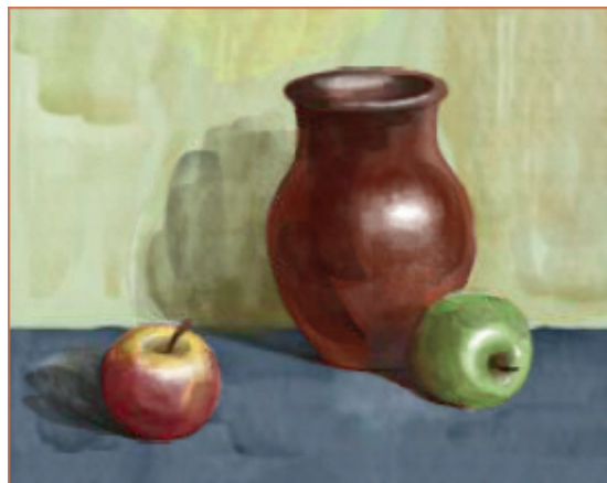
İLL 2. Natürmortun çəkilməsi metodikası

2. Təsviri sənət fənninin tədrisi metodikasında pedaqoq təhsilənlər arasında bərabər imkanlar yaratmalıdır. Müəssisənin təhsil infrastrukturuna uyğun olaraq, təhsilənlər üçün eyni təlim şəraiti qurulmalıdır. Həmçinin təhsil prosesində şagirdlərin maraq və potensial imkanları nəzərə alınmaqla tənzimlənməlidir. Fənnin tədrisi metodikasında müəllim bütün siniflə məşğul olmalıdır, rəsm çəkmək bacarığı zəif olan şagirdlərə öz səviyyələri üzrə tapşırıqlar verməlidir. Müəllim nümunəvi açıq dərslər keçərkən bərabər iştirak etmə prinsiplərini qorumaqlı və bütün şagirdləri dinləməlidir.